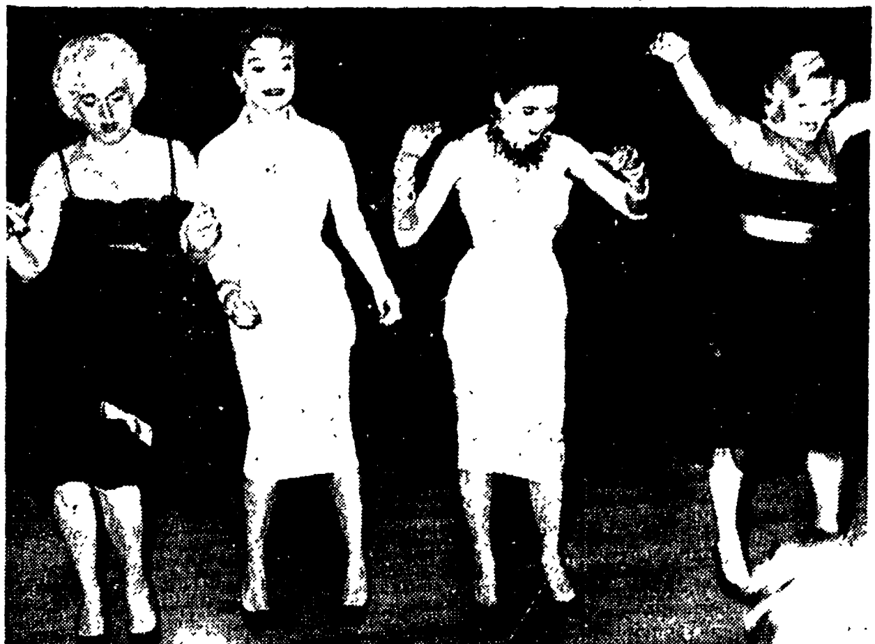
HOLLYWOOD — Quattro ballerine d'eccezione, da sinistra: le attrici Dagmar (lanciatrice), Patricia Wymore (vedova dell'attore Errol Flynn), Julie Wilson e Marilyn Maxwell mentre provano con tutto impegno un balletto nel quale si esibiranno a Las Vegas, nello spettacolo «Tre play girls»

Commentando i colloqui tra Adenauer e Macmillan