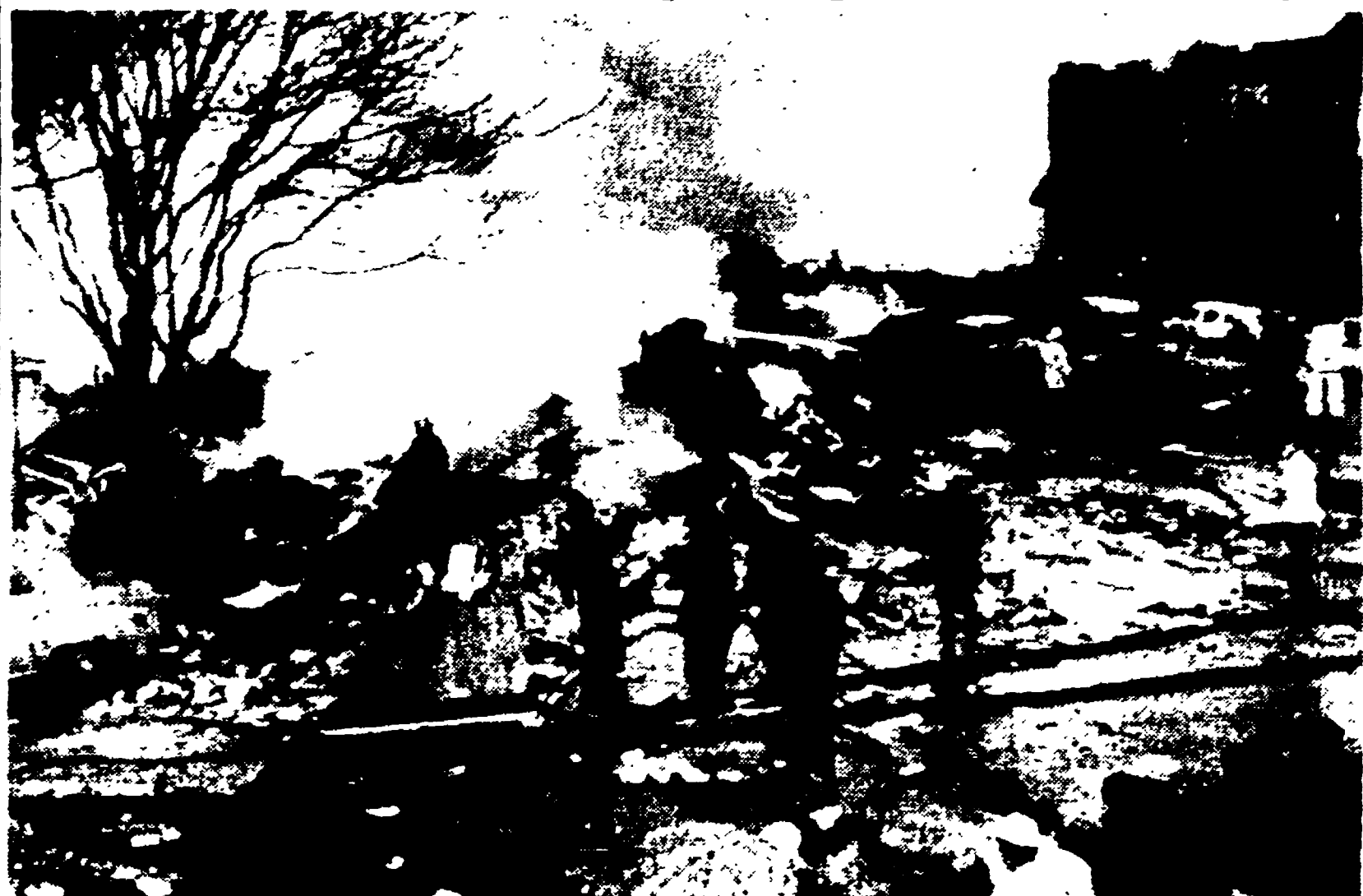
CHICAGO. - Un gigantesco aereo da trasporto è precipitato ieri all'alba sulla periferia di Chicago. Nella telefoto: Una veduta semicircolare del luogo del disastro. Sono visibili, al centro della telefoto una parte della carcassa dell'aereo avvolta dal fumo e numerosi vigili del fuoco che stanno spegnendo gli ultimi focolai dell'incendio; a destra una casa con tutti i vetri infranti ed annerita dall'esplosione