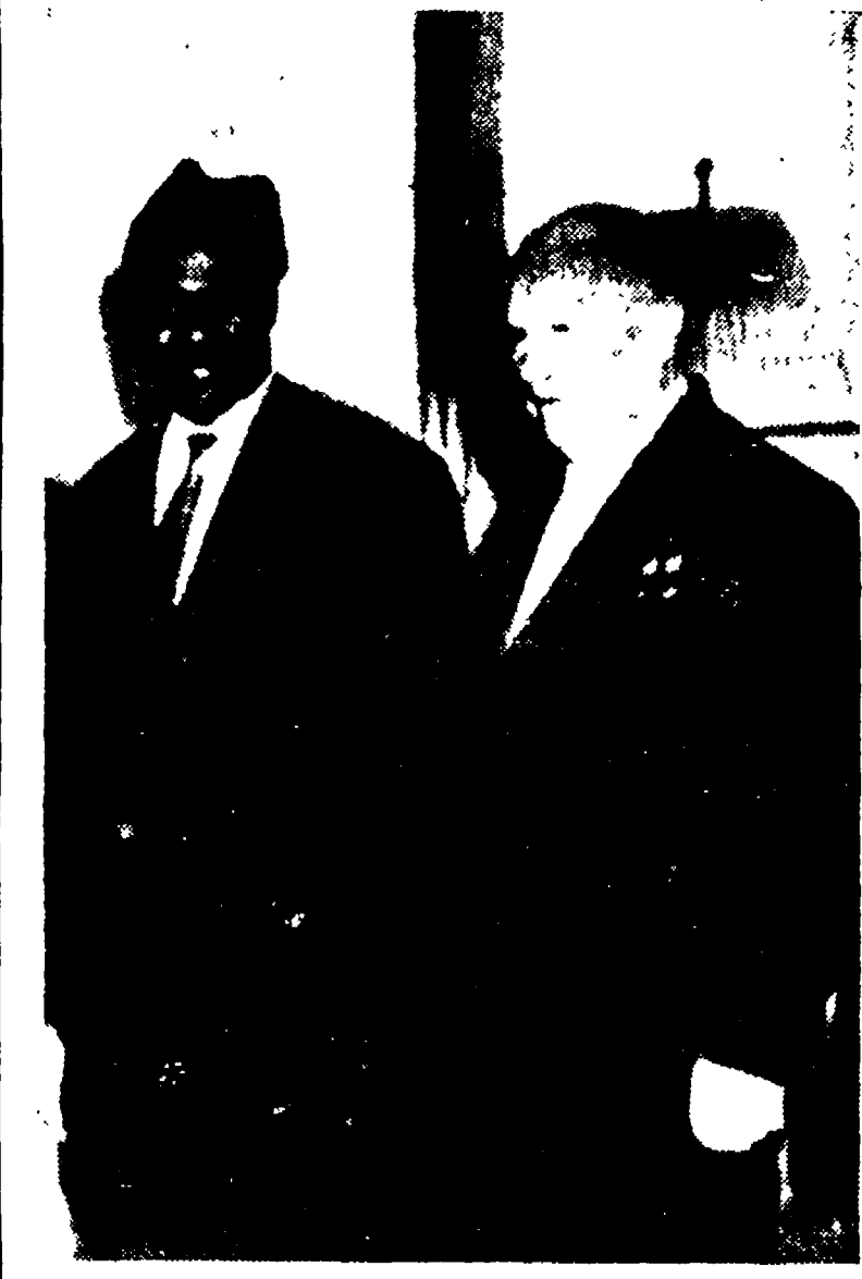
MOSCA. - Il primo ministro sovietico Krusciov con il presidente della Guinea Seku Turè si sono incontrati a Gargy, una stazione balneare sul Mar Nero (Telefoto)

giungenti di importazione previsti per questa data all'inizio del MEC.