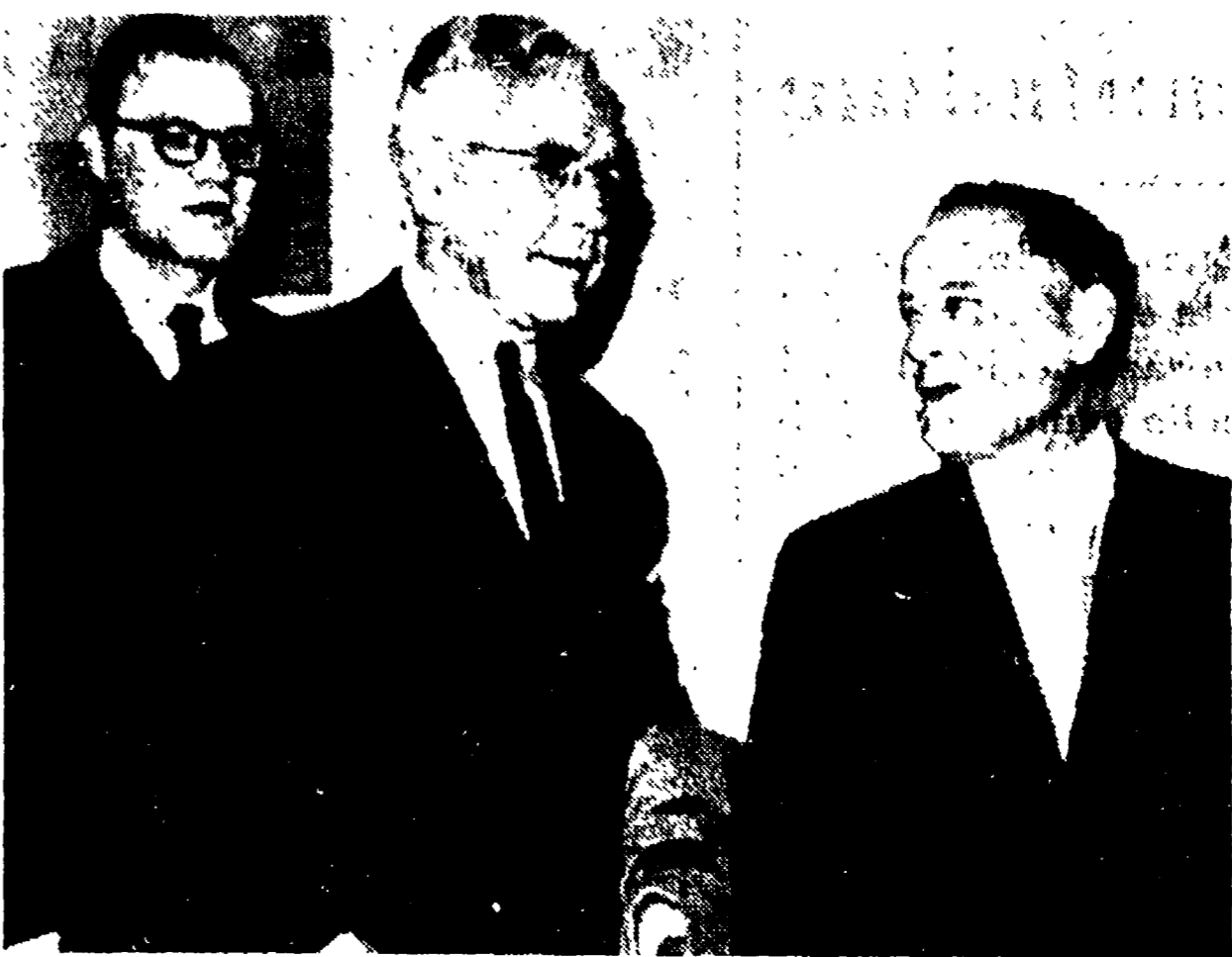
WASHINGTON. - I dirigenti dei programmi per l'energia atomica degli Stati Uniti e dell'Unione Sovietica, rispettivamente John A. McCone (centro) e Vasily Emelianov (destra), sono stati ricevuti dal presidente Eisenhower alla Casa Bianca. Nella foto sono visibili all'uscita dall'aula di Eisenhower, Dietrich (a sinistra), l'interprete del Dipartimento di Stato Raymond Garoff

del « vertice » al 1961 e a favore di un accordo tra « grandi » che modifichi, con vantaggio delle due parti, la scena politica attuale. Berlino. Oggi viene reso noto un rapporto che il Council of foreign relations ha redatto per incarico della commissione esteri del Senato, il rapporto che auspica l'avvio ad una revisione della politica di Washington verso la Cina. Sotto il titolo « Gli obiettivi fondamentali della politica estera degli Stati Uniti », gli studiosi di problemi internazionali autori del rapporto affermano che « a parità di quel che si deve o non si