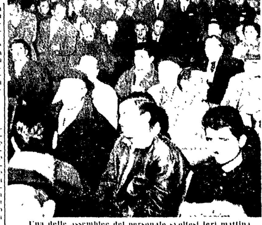
Una delle assemblee del personale svoltesi ieri mattina

Il prolungamento fino a via Miramonte Bragadin e non appena sarà ultimata la costruzione dell'Hotel degli Oboli, fino a piazza Inverno. La linea 23 invece sempre in parte dal 17 dicembre, sarà definitivamente instaurata da largo Trionfale a via della Giustizia, che sarà in funzione per piazza Clodio, via Tiburtina, piazza Strada, via Patumbone e via della Giustizia.