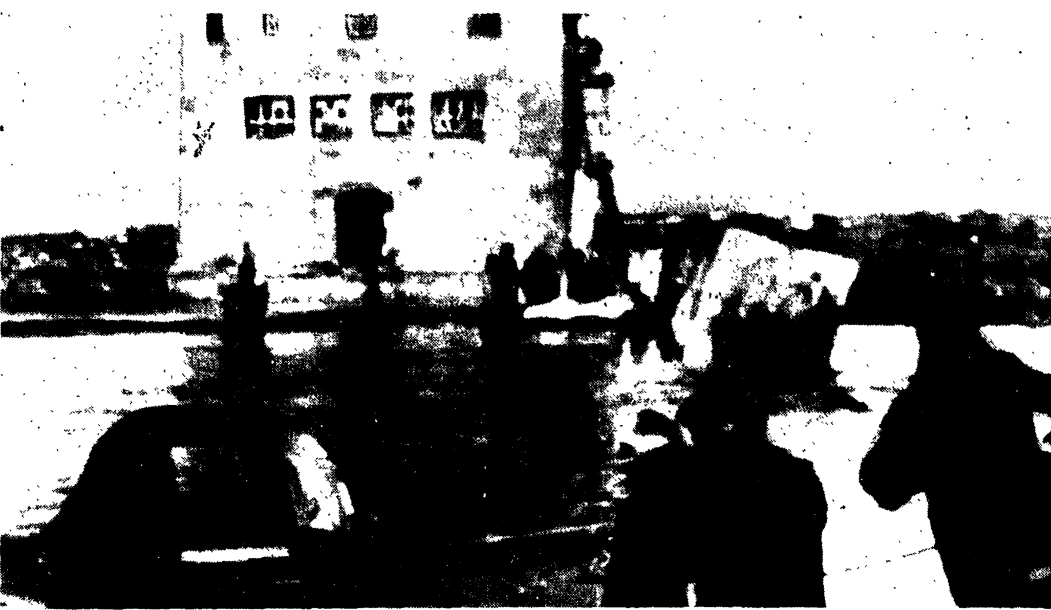
FREJUS - Ecco come si è presentata stamane al soccorritori la zona investita dalla furia delle acque

Improvviso nella notte si udì il rombo della diga che crollava; poi 50 milioni di metri cubi d'acqua precipitarono a valle distruggendo tutto - Sembra che finora siano stati recuperati 350 cadaveri