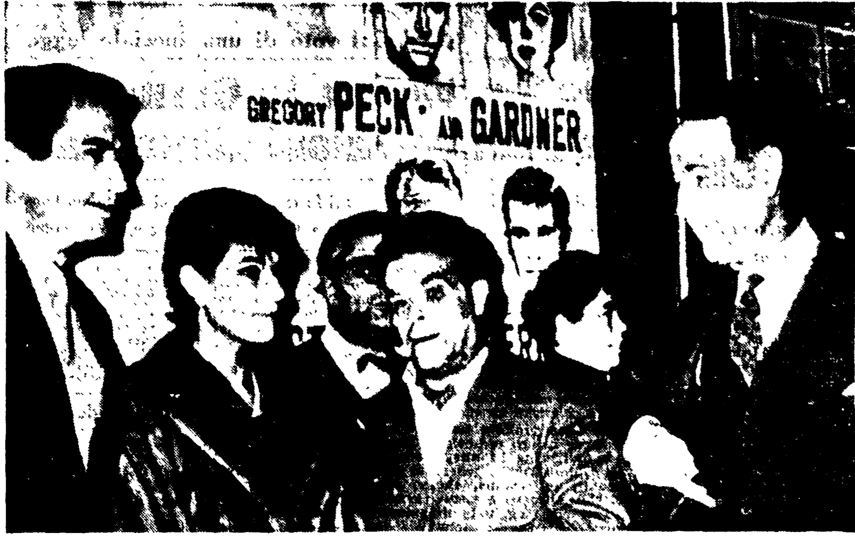
MOSCA — La prima del film «On the beach» (Sulla spiaggia) nella capitale sovietica. Nella telefoto (da sinistra): Gregory Peck uno dei protagonisti con la moglie, il produttore russo Mark Donskoy e l'ambasciatore americano Thompson, fotografati nel ridotto del teatro