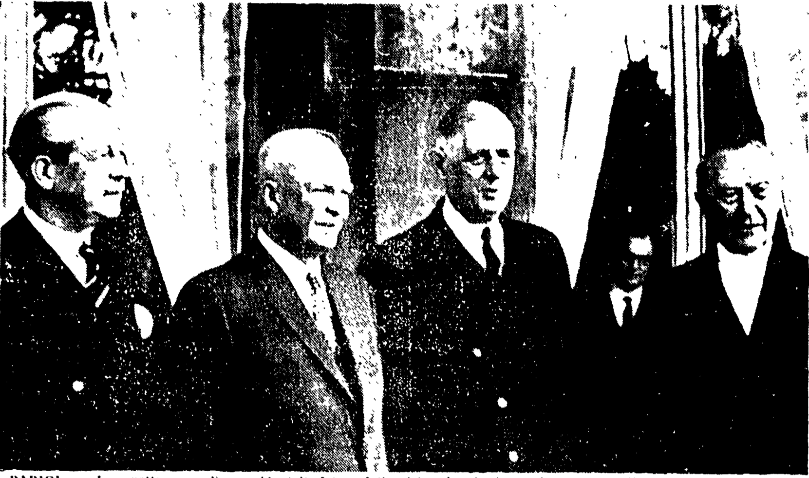
PARIGI — I «quattro grandi» occidentali fotografati al termine del loro colloquio sui gradini dell'Eliseo. Da sinistra: Macmillan, Eisenhower, De Gaulle e Adenauer

I congressi di sei Federazioni comuniste hanno dato inizio sabato e domenica scorsa al periodo più intenso della attività pre-congressuale. Dovunque, il dibattito è stato approfondito, vivacemente critico e costruttivo. Pubblichiamo oggi una intera pagina dedicata ai resoconti dei congressi di Caserta, Macerata, Viterbo e Tempio Pausania e alle conclusioni di quello di Fermo. Si è svolto inoltre il congresso di Crema.