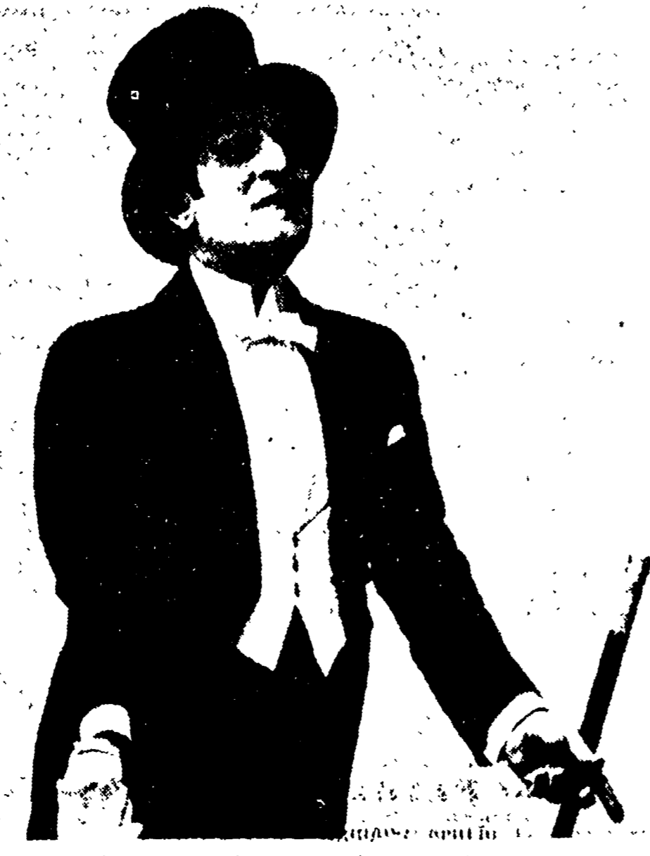
Da una vecchia foto: Petrolini mentre interpreta Gastone