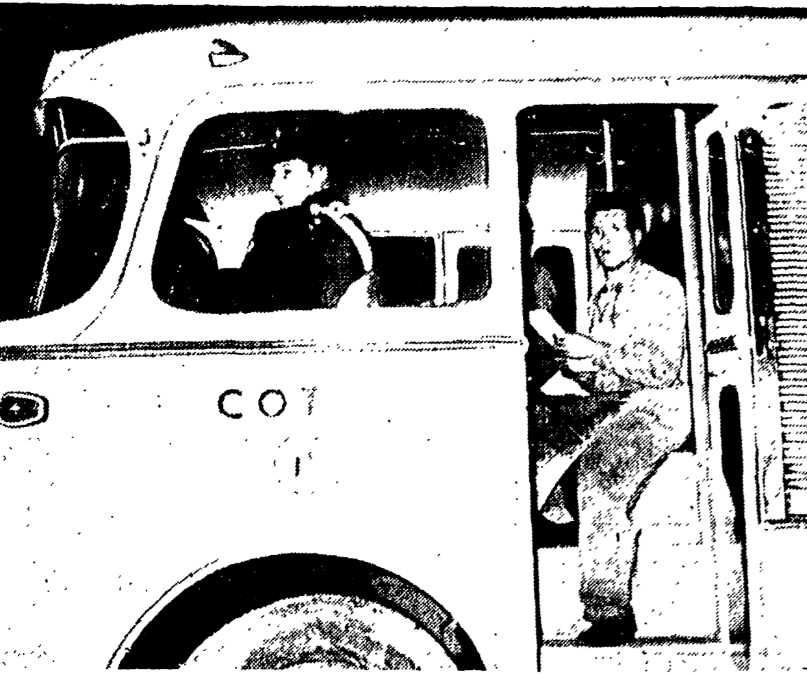
An carabiniere accanto all'autista su un autocarro della CO TAL durante lo sciopero di ieri

Gli automezzi scortati dai carabinieri - Responsabilità della azienda e dell'Ufficio del Lavoro per l'inasprirsi della vertenza