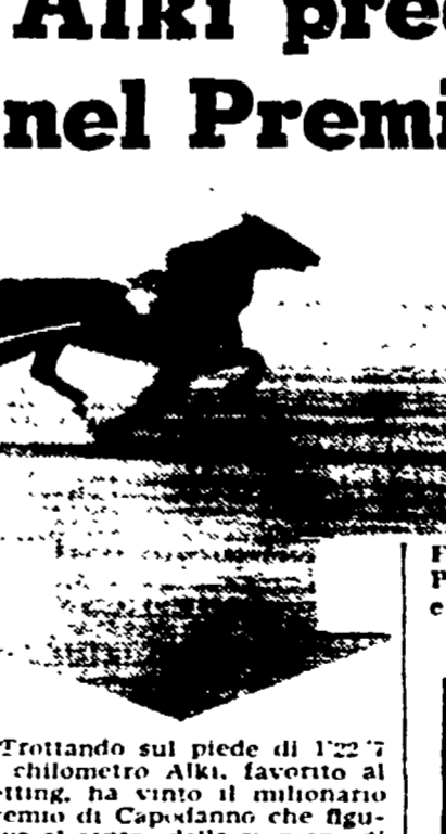
Fotofinish al Tor di Valle: sul traguardo del Premio di Capodanno il favorito ALKI precede OVIEDO e lo sfortunato BALABANG. Alki ha trotolato sul piede di 1'22"7 al chilometro.