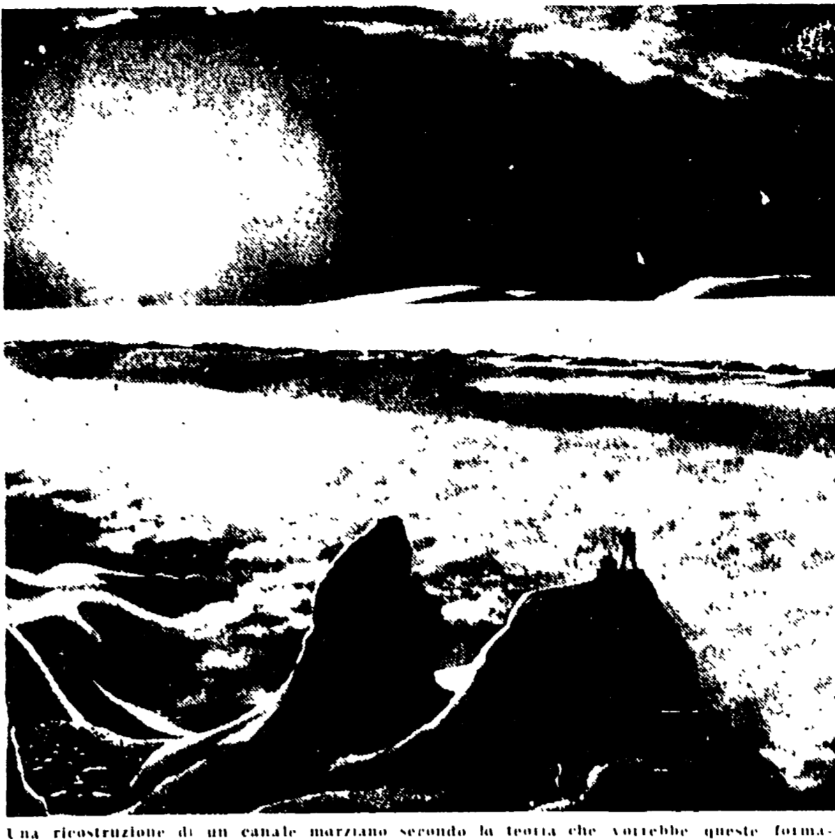
Una ricostruzione di un canale marziano secondo la teoria che vorrebbe queste formazioni del pianeta forte piene di nubi.

Il motivo di Marte planetario «vecchio», che non riesce più a dar vita ai suoi abitanti, motivo che dopo l'ultima guerra dei mondi di H. G. Wells ha ispirato centinaia di racconti di «fantascienza», sin quasi ad assurgere a una sorta di convenzione fra gli scrittori di questo genere, ha un suo fondamento scientifico nei risultati delle esplorazioni di Marte già compiute dall'uomo. Uno qui il termine «esplorazione» in un significato più largo, e forse più moderno, del consueto. Perché, infatti, dobbiamo dire che l'uomo esplora un nuovo mondo solo quando il calco con il suo piede? Nessun uomo ha ancora toccato lo stivato di Marte; eppure possediamo discrete «mappe» della pianeta rosso, sappiamo qualcosa sulle sue stagioni, sul suo clima, sulla sua meteorologia; possiamo esprimere delle ipotesi scientifiche, e non solo fantascientifiche, sulle forme di vita presenti alla sua superficie.