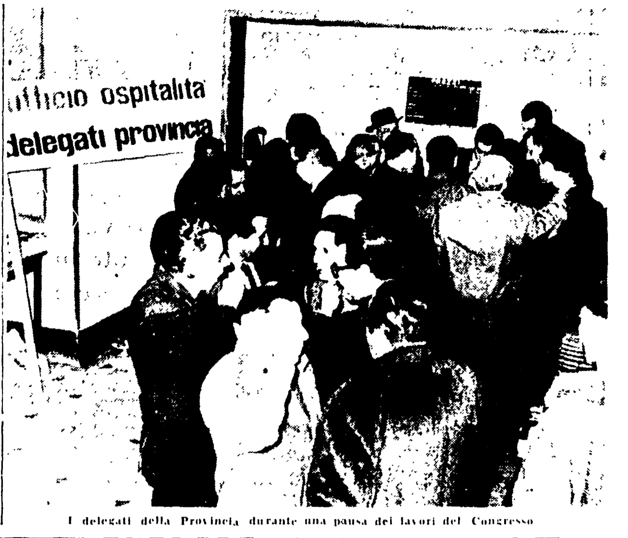
I delegati della Provincia durante una pausa dei lavori del Congresso