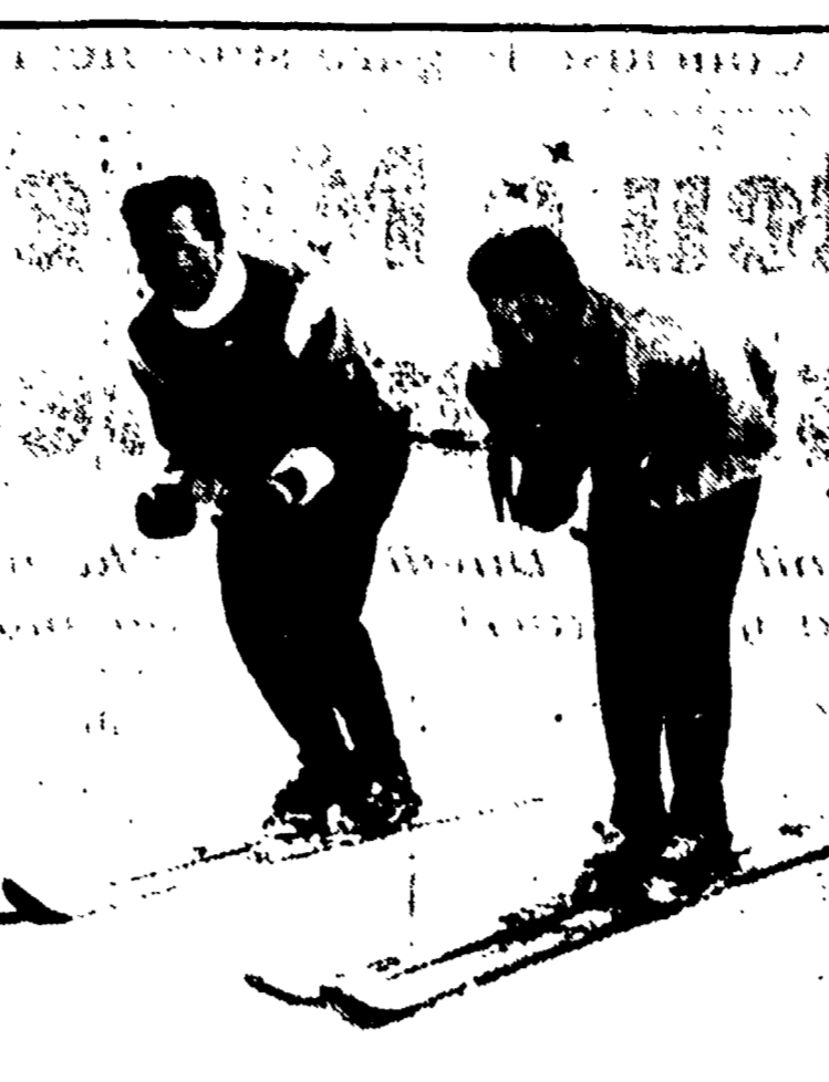
« L'irridato » è giunto secondo a un minuto e 50" dal vincitore - Ferri e Guercio, terzo e quarto, a circa 4 minuti

(Dal nostro inviato speciale) ARCORE, 17. — Imprevdabile terremoto nella odierna edizione di Arcore organizzata dalla locale F.S. Popolare Arcorese: il campione del mondo Renato Longo è stato nettamente battuto da Amerigo Severini in questo il preciso verdetto della gara di Arcore.