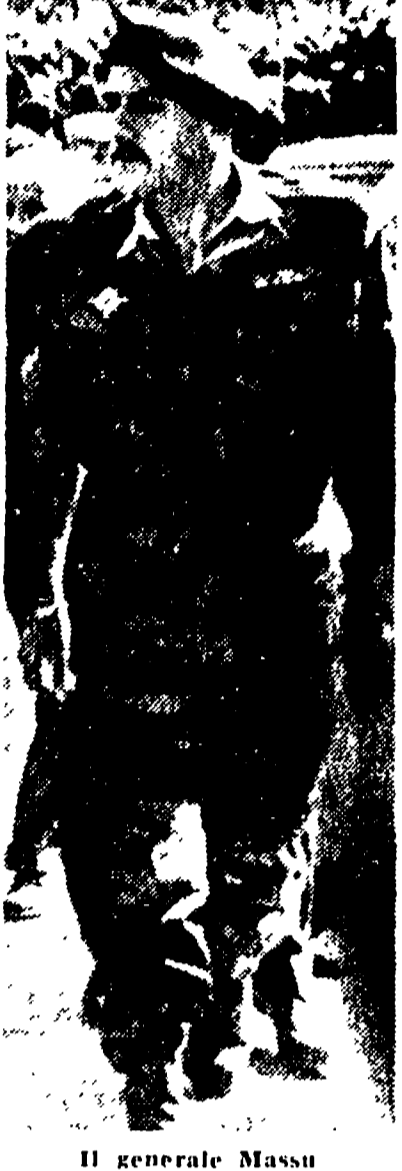
Il generale Massu