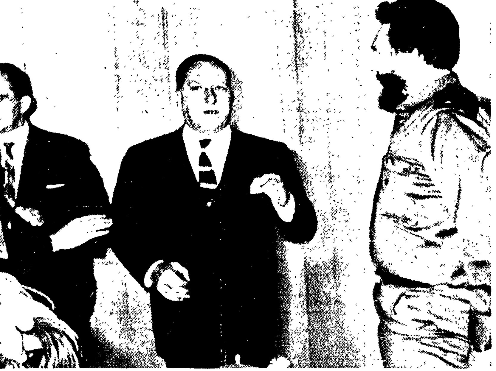
LAVANA. - L'ambasciatore spagnolo Juan Pablo de Lojendio gestisce rivolto a Fidel Castro (in divisa di profilo) pochi attimi prima di venire espulso dallo studio televisivo e dal paese.

Il diplomatico falangista aveva fatto irruzione negli studi televisivi pretendendo di interrompere un discorso del « premier » cubano