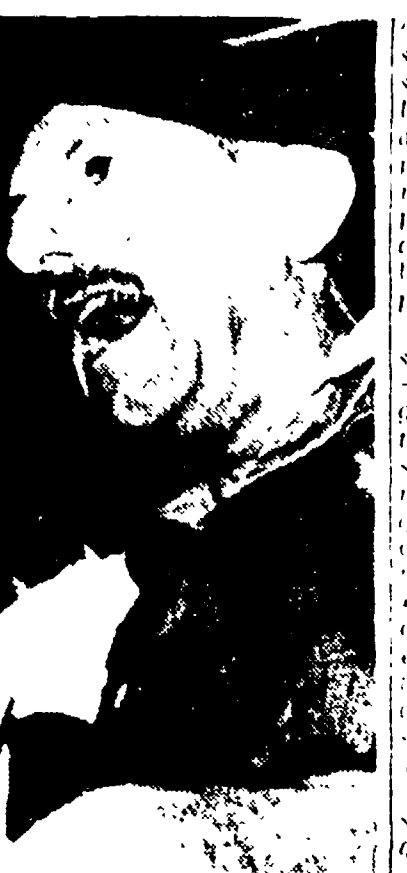
Il generale Massu