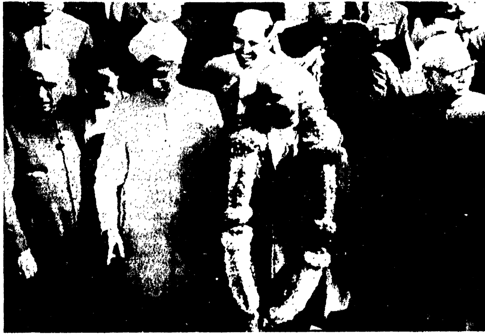
NUOVA DELHI - L'arrivo di Krusciov, salutato all'aeroporto dai massimi dirigenti indiani. Da sinistra a destra, il primo ministro Nehru, il vicepresidente Radhakrishnan, Krusciov con una grande schiera di fiori che gli è stata offerta in segno di benvenuto e il presidente indiano Prasad.

Centinaia di migliaia di persone applaudono il corteo - Grandi ovazioni durante il discorso alla Camera - « Siete un grande combattente della pace » dichiara il Presidente indiano