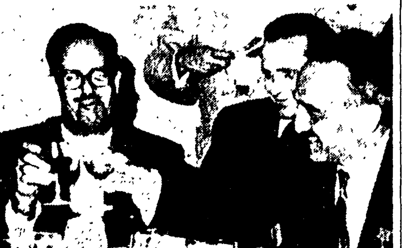
L'AVANA - Il vice primo ministro sovietico Anastas Mikoian brinda con Fidel Castro e con il presidente di Cuba Osvaldo Dorticos (al centro) durante un banchetto offerto in suo onore.

accompagnato da Fidel Castro, ha compiuto nell'isola alle opere di riforma e agli istituti cooperativi - il vice primo ministro dell'URSS è stato ospite d'onore ad un ricevimento dato dall'Associazione nazionale degli industriali cubani. Il ricevimento si è svolto in un'atmosfera amichevole, e vi hanno partecipato il mini-