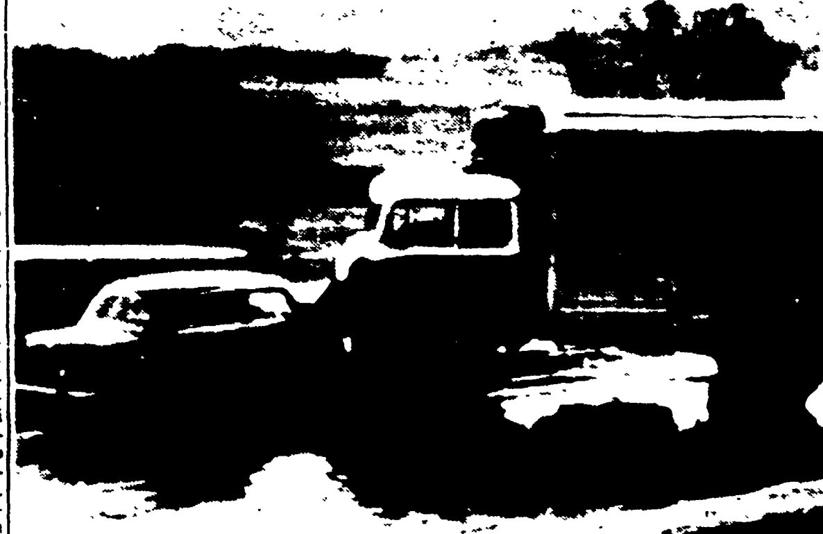
VIENNA - Il cardinale Johannes Koenig, arcivescovo di Vienna, che si recava ieri mattina in macchina a Zagabria per assistere ai funerali del cardinale Stepinac, è rimasto vittima di un grave incidente stradale ed è attualmente ricoverato in gravissime condizioni all'ospedale di Varsavia, cittadina ceca presso il confine austriaco. L'assistente del cardinale, un sacerdote viennese, è rimasto ucciso sul colpo. Un altro prete che accompagnava Koenig è in condizioni disperate. L'incidente si è verificato sulla variabile Vienna-Zagabria, presso Varsavia, alle 8 del mattino. Per ragioni non ancora precisate l'auto è andata ad urtare un pesante autocarro. Nella telefoto: l'auto e il camion dopo lo scontro