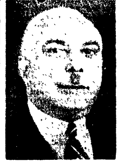
Il dittatore Trujillo

Su questa situazione incombuono la presenza, nelle acque di Ciudad Trujillo, di sette navi da guerra degli Stati Uniti, che hanno rovesciato sulla terra dominicana, in una visita di cortesia, quattro mila marinai.