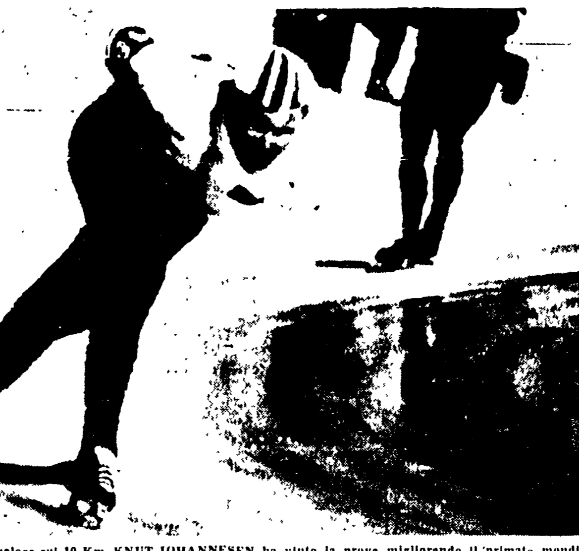
Nell'ultima gara di pattinaggio veloce sul 10 Km. KNUT JOHANNESEN ha vinto la prova migliorando il primato mondiale