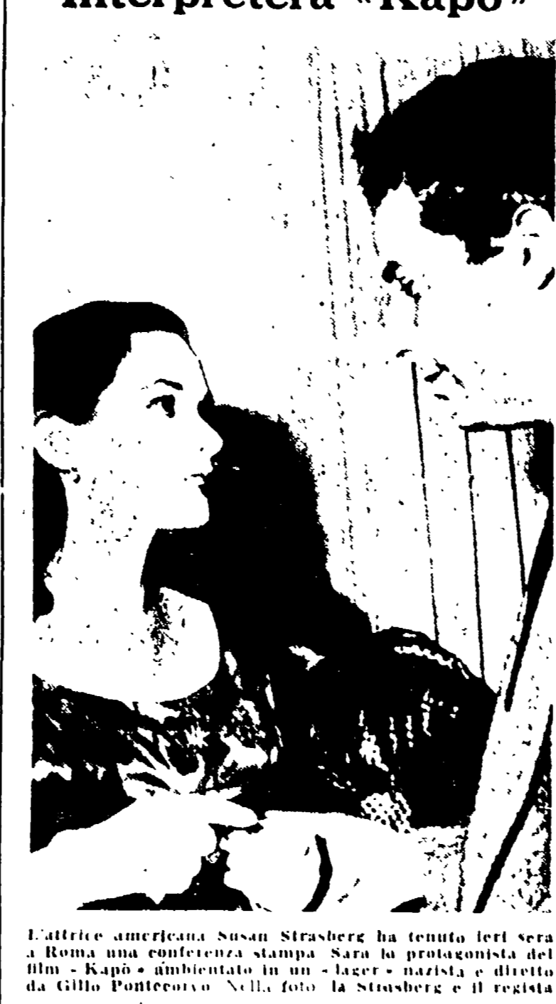
L'attrice americana Susan Strasberg ha tenuto ieri sera a Roma una conferenza stampa...