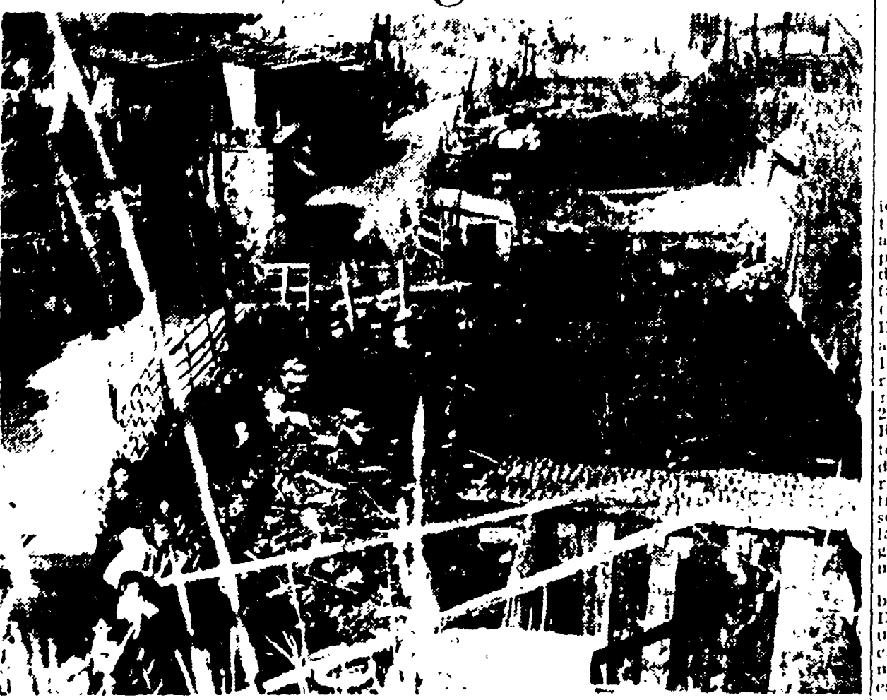
Al centro dell'agglomerato di baracche in via Angelo Emo (nella foto) si è formata una crepa che si è allargata in una pozza di acqua piovana che raggiunge una profondità di 3 metri. Il rischio è che si verifichi un crollo.