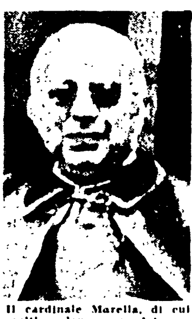
Il cardinale Marella, di cui molti parlano come del possibile successore di Tardini

Un freddo commento dell'« Osservatore » - A chi si rivolgeva il segretario di Stato quando ha parlato di « altri » che dovrebbero seguire il suo esempio?