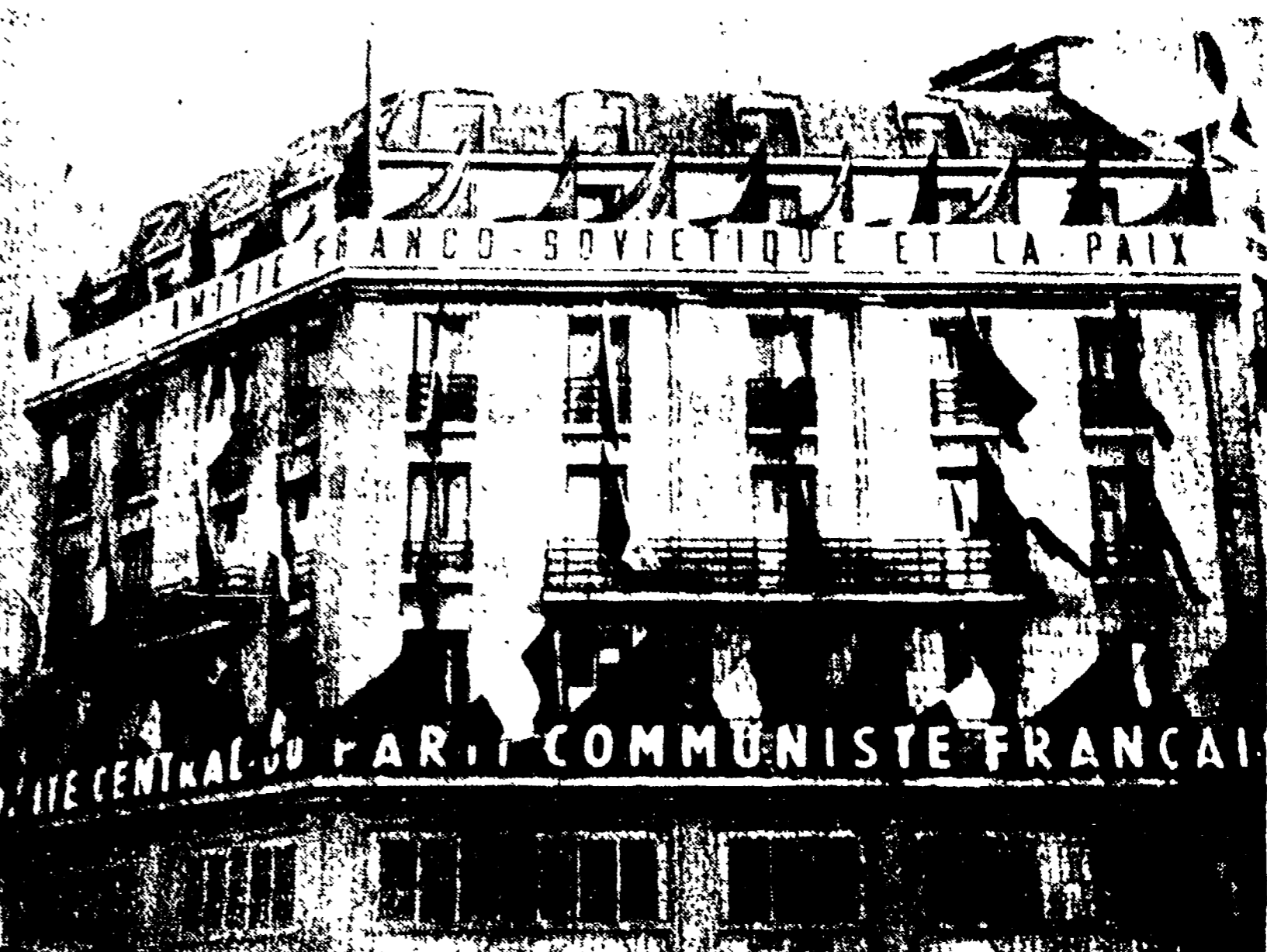
PARIGI - Da Place de la Concorde alla «cintura operaia», migliaia di bandiere e festoni sono fioriti per salutare Krusciov. Anche le altre città che il Premier «Avverrà si preparano ad accogliere l'ospite. Nella foto: la sede del PCF, decorata con bandiere francesi e sovietiche e una striscione che dice «Viva l'Alleanza franco-sovietica e la pace».

Per la prima volta un Premier sovietico in Francia