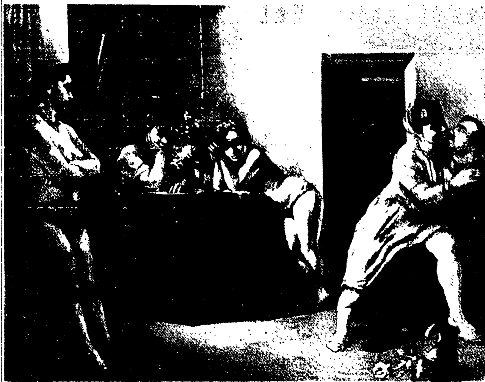
ALBERTO ZIVERI: «Postribolo» (1915)

stessa vita del sindacato, così come è descritta da Swados, se può dare il calore della istintiva solidarietà operaia, non può sottrarsi alla schiavitù simbolica della catena.