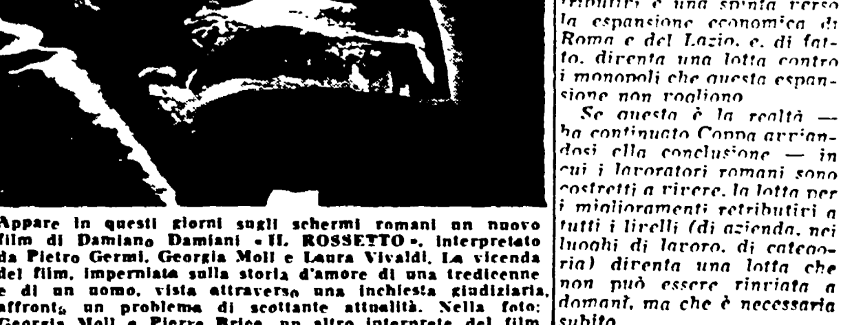
Appare in questi giorni sugli schermi romani un nuovo film di Damiano Damiani «IL ROSSETTO». Interpretato da Pietro Germi, Georgia Moll e Laura Vivaldi...