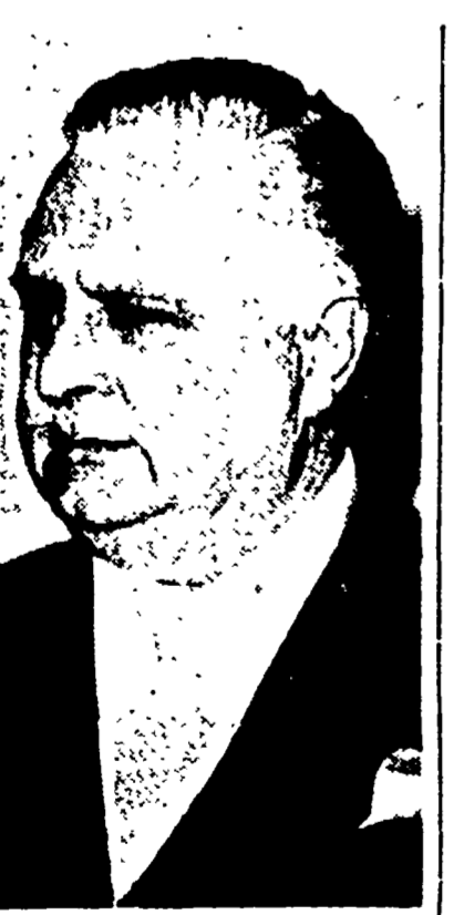
Il presidente dell'Ente di Stato

Il presidente dell'Ente di Stato vuole privatizzare numerose imprese