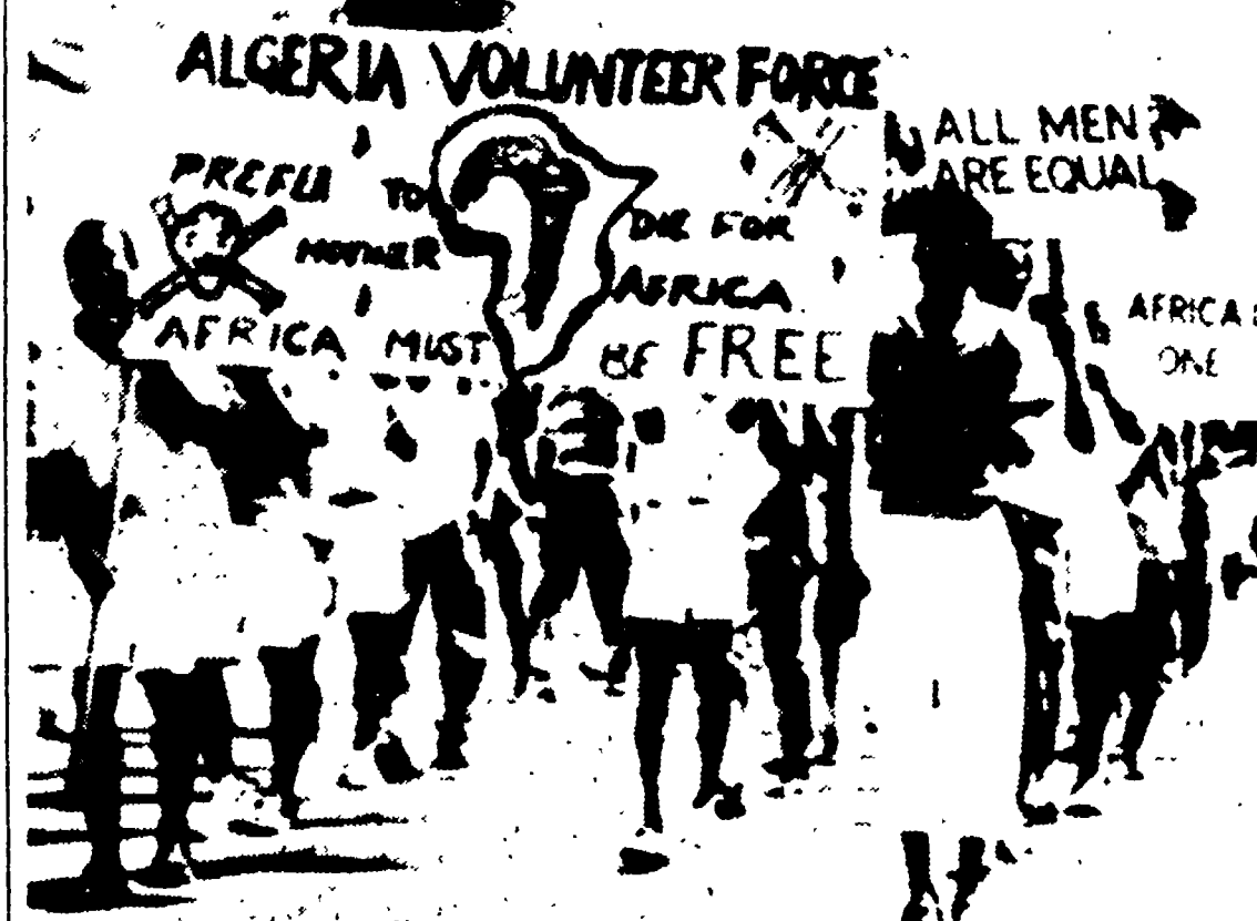
ACCRA - Nel corso di una grande manifestazione popolare, gli africani hanno ribadito combattivamente le loro rivendicazioni. Il cartello più grande, sotto la testata «Forza volontaria d'Algeria», reca la scritta: «Preferiamo morire per la madre Africa, l'Africa deve essere libera»...