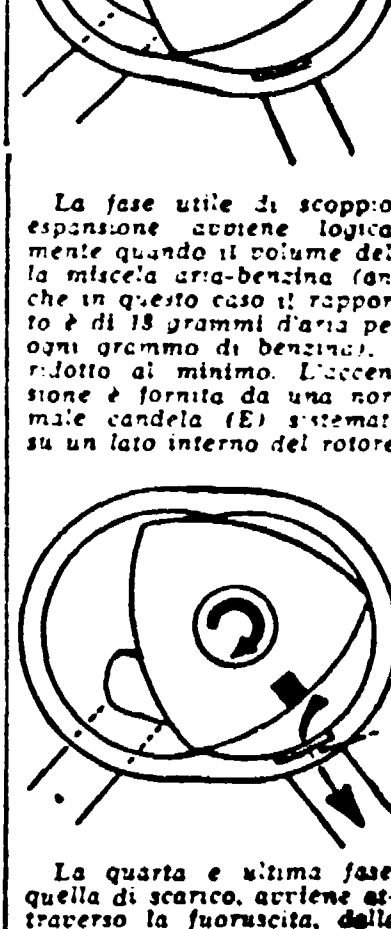
La quarta e ultima fase, quella di scarico, avviene attraverso la fessura, della luce (F) del gas bruciato.