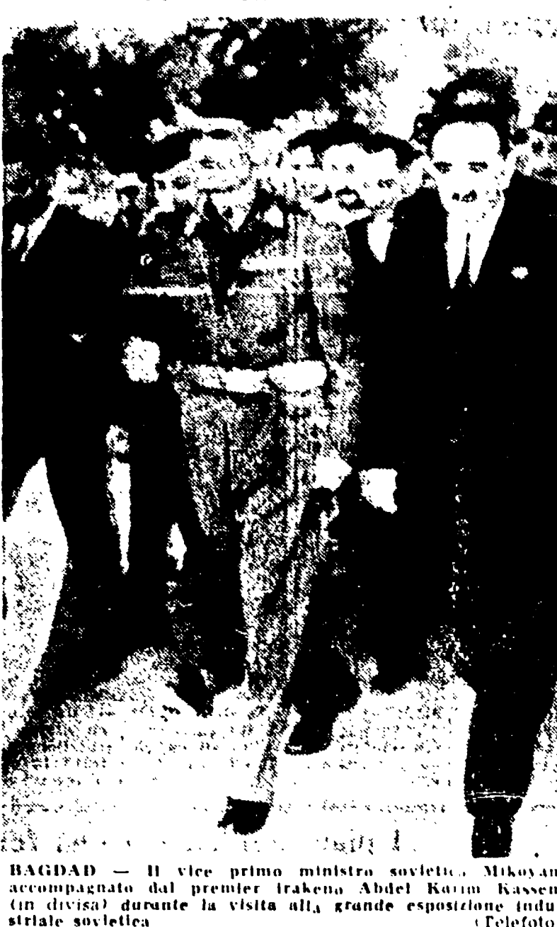
Bagdad — Il vice primo ministro sovietico, Mikoian, accompagnato dal premier irakeno Abdel Karim Kassem, durante la visita alla grande esposizione industriale sovietica.