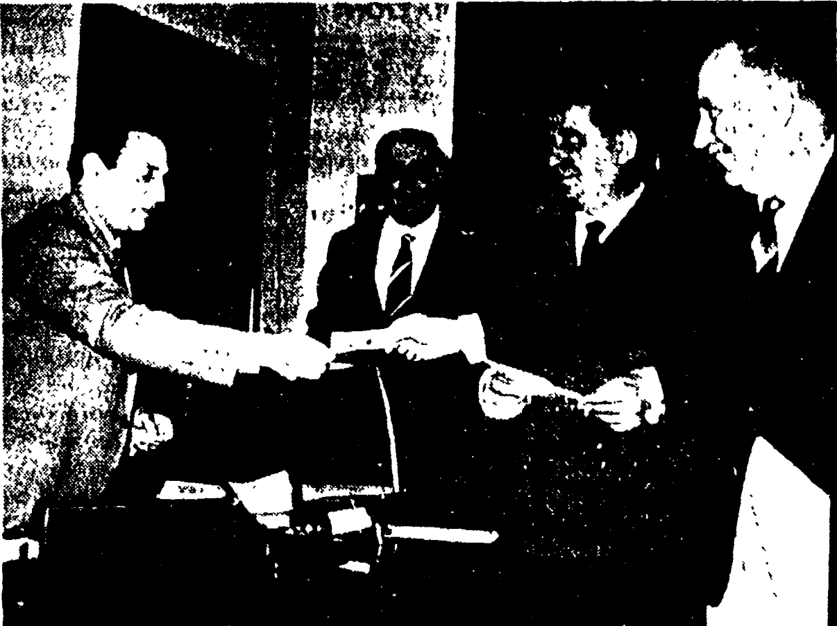
Un funzionario della banca consegna il biglietto del cento milioni all'ispettore generale del Lotto e delle lotterie

Ieri mattina due funzionari di una banca di Roma hanno consegnato nelle mani dell'ispettore generale del Lotto e Lotterie, dottor Panusa, il biglietto vincente del primo premio, per cento milioni, della Lotteria di Agnano.