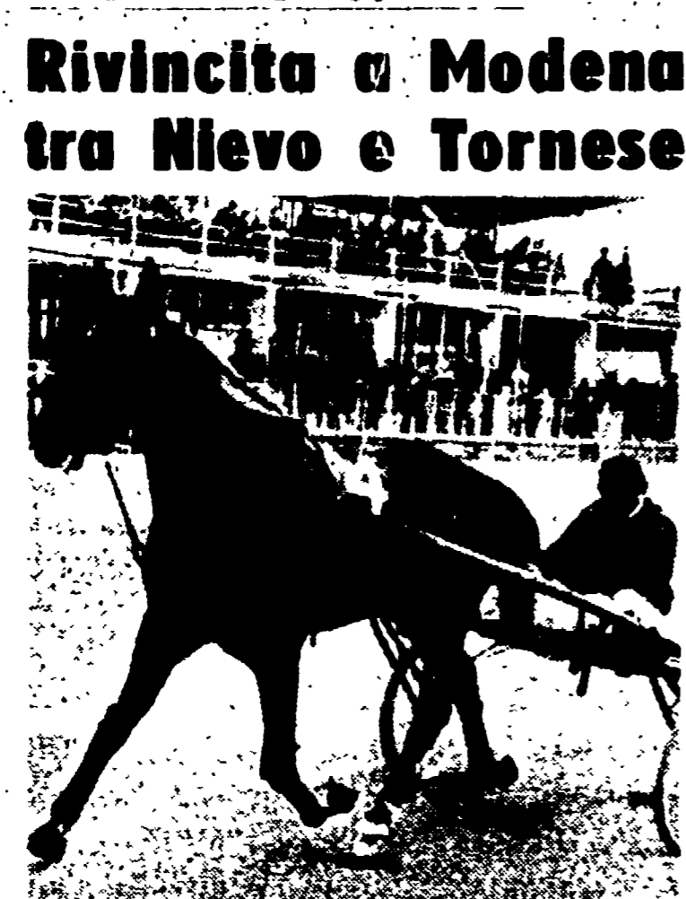
Al ippodromo di S. Siro Vittoria di Noa Noa

Al Betting Vittoria e Min- tutto si dividevano i favori della quota ed erano offerti da 2 mentre a tre ed anche a quattro era Ivozio, a cinque e sei Dama. Al via andava al comando Tobia davanti ad Ivozio, Vittoria, Astolfo e gli altri in fila indiana.