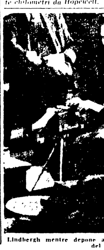
Lindbergh mentre depone al processo contro il rapitore del figlio.

È il più famoso e anche quello che ha pratica, inaugurò la mostruosa tecnica del kidnapping è legato al nome di Charles Lindbergh, il pilota che per primo trasvolò l'Atlantico a bordo di un bimotore monomotore. Diventò ricco. Lindbergh si era ritirato, con la moglie e il figlioletto Charles junior, in una casetta ai piedi delle montagne del Sourland, nei pressi di Hopewell, nel New Jersey.