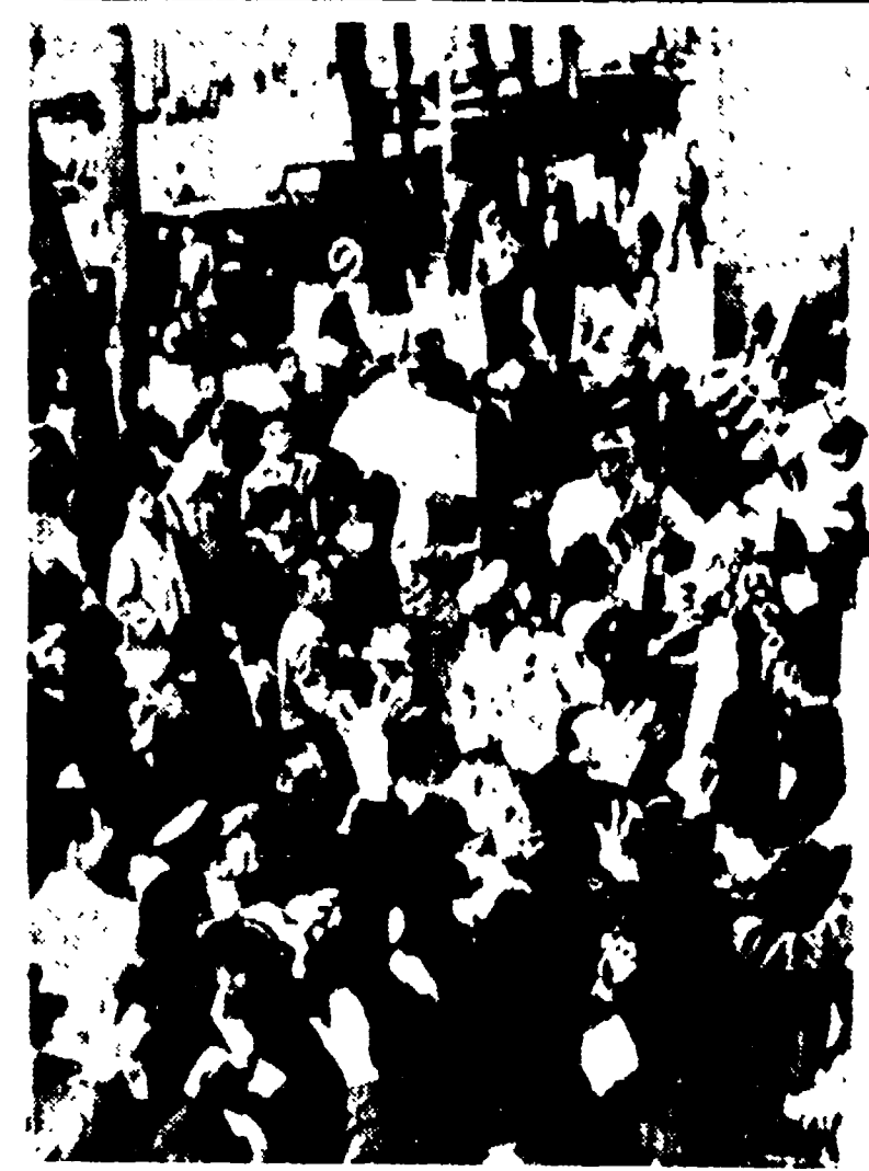
SEUL - Numerosi cittadini, davanti alla sede di un giornale, afferrano al volo le copie che vengono lanciate dalle finestre, con la notizia delle dimissioni del governo.

Ancora confusa e tesa la situazione nella Corea Meridionale