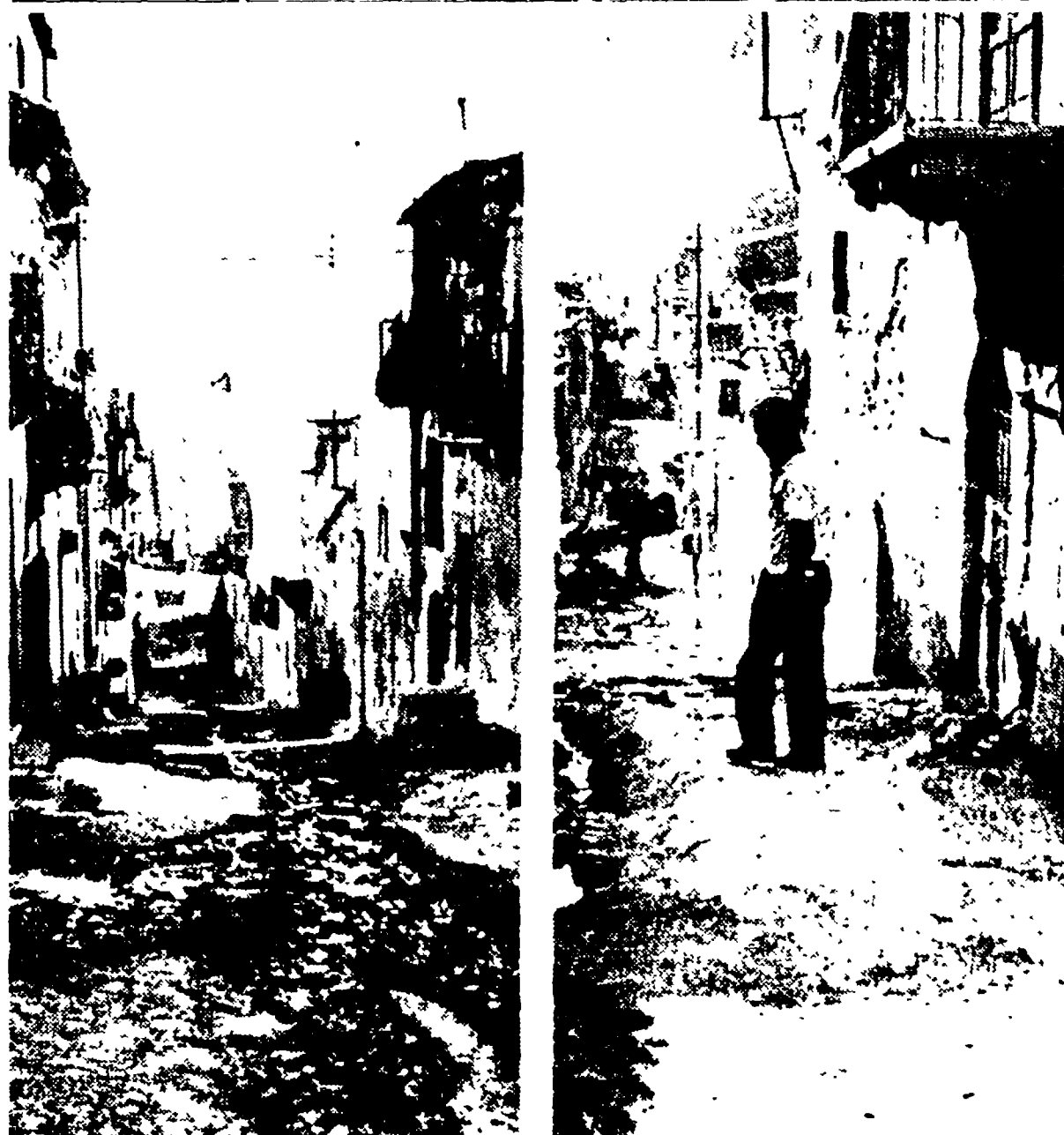
Due strade di Palma di Montechiaro

che, anzi, non può non realizzarsi in Sicilia attorno ad alcuni problemi reali... LUCIO LOMBARDO RADICE