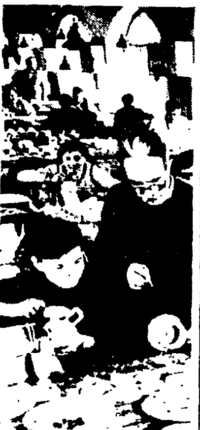
Dalla cittadina di Herend partono per tutto il mondo alcune tra le più pregiate porcellane oggi esistenti. Nella foto: in un reparto della fabbrica giovani apprendisti imparano l'arte della pittura a mano.