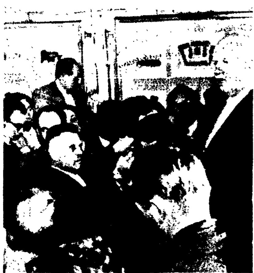
(Dal nostro corrispondente)

Isolamento degli Stati Uniti: i loro alleati e satelliti scindono le responsabilità - La posizione dell'URSS alla vigilia del vertice