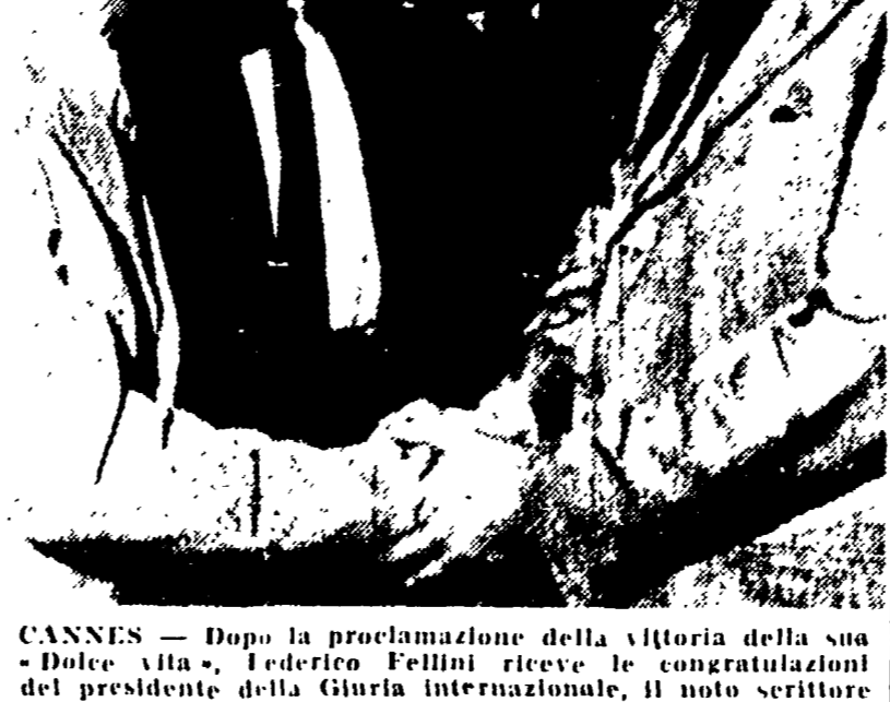
«La ballata del soldato», che ha avuto anche il premio di «miglior film per la gioventù»