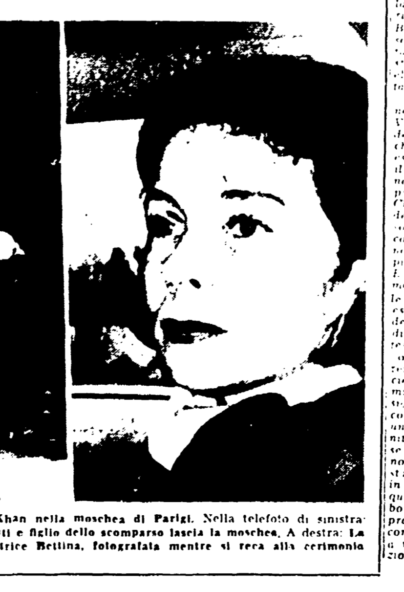
Preghiere ismailite per Ali Khan nella moschea di Parigi. Nella telefoto di sinistra: Karim, Agha Khan degli ismailiti e figlio dello scomparso Ismail. A destra: la compagnia di Ali, l'ex-indovnatrice Bettina, fotografata mentre si reca alla cerimonia.

una produzione industriale al servizio della cultura