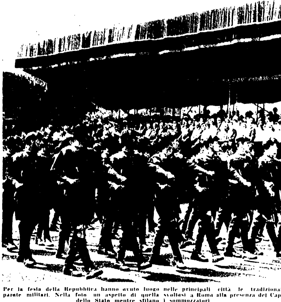
Per la festa della Repubblica hanno avuto luogo nelle principali città le tradizionali parate militari. Nella foto un aspetto di quella svoltasi a Roma alla presenza del Capo dello Stato mentre sfilano i sommozzatori