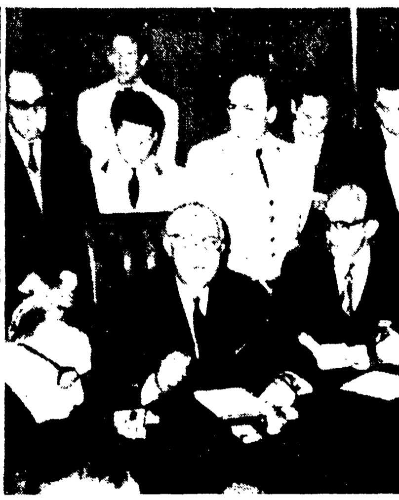
ANKARA - Il ministro degli Esteri turco Selim Sarper durante la conferenza stampa di ieri