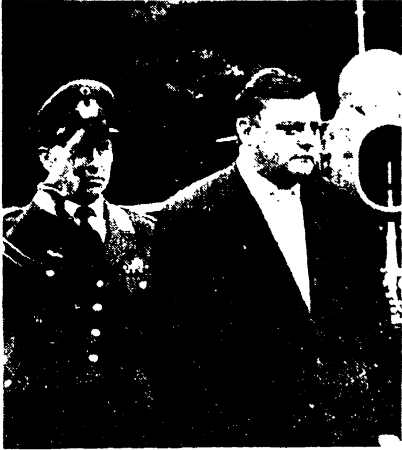
Il ministro della guerra di Bonn, Strauss

Impudenti discorsi sulla «marcia verso l'est» - L'adesione del socialdemocratico Ollenhauer - Il ministro della guerra di Bonn andrà negli Stati Uniti per chiedere nuove armi per la Bundeswehr