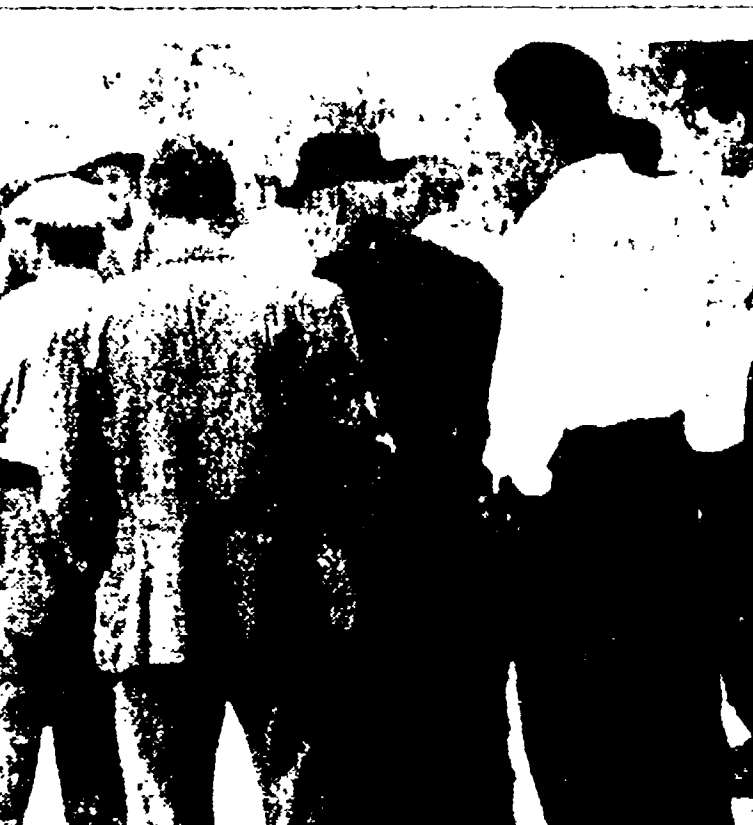
ORTE - Una grande manifestazione di mezzadri si è svolta domenica al teatro «Alberini». Nel corso della quale ha parlato il compagno Arturo Colombo della Direzione del PCI. Nei pomeriggi parlamentari comunisti si sono incontrati con i mezzadri in tre piazze della zona di Rocca, in un podere a Casertano e in due poderi della zona di Bauche. Nella foto, Colombo con i lavoratori della terra.

Iniziate ieri le tre giornate di lotta proclamata unitariamente dai sindacati - Dopo il nuovo rifiuto della Confida la situazione tende ad acuirsi - Diecimila braccianti sfilano per le vie di Andria chiedendo l'aumento dei salari