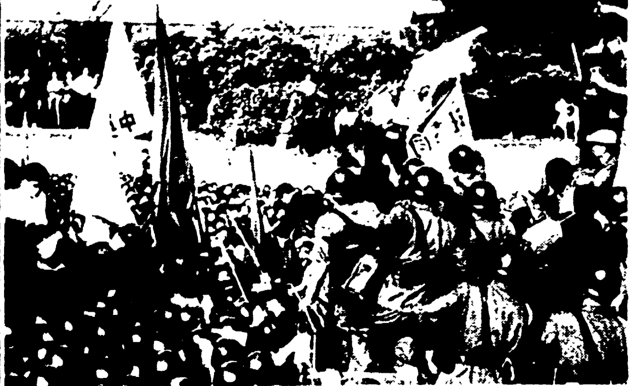
TOKIO — Veduta generale di una folla di studenti ammassata davanti alla residenza del premier Kishi. Numerosissimi poliziotti di spalla, alcuni dei quali su un camion fronteggiano i dimostranti.

WASHINGTON. 7. — I gruppi dirigenti americani intendono adesso provocare una nuova fase di acuta tensione in Estremo Oriente. Questa è la domanda che si pongono oggi gli osservatori dopo la provocatoria decisione presa ieri dal Pentagono di porre in stato d'allarme la settima flotta americana del Pacifico sino al completamento del viaggio di Eisenhower in Estremo Oriente.