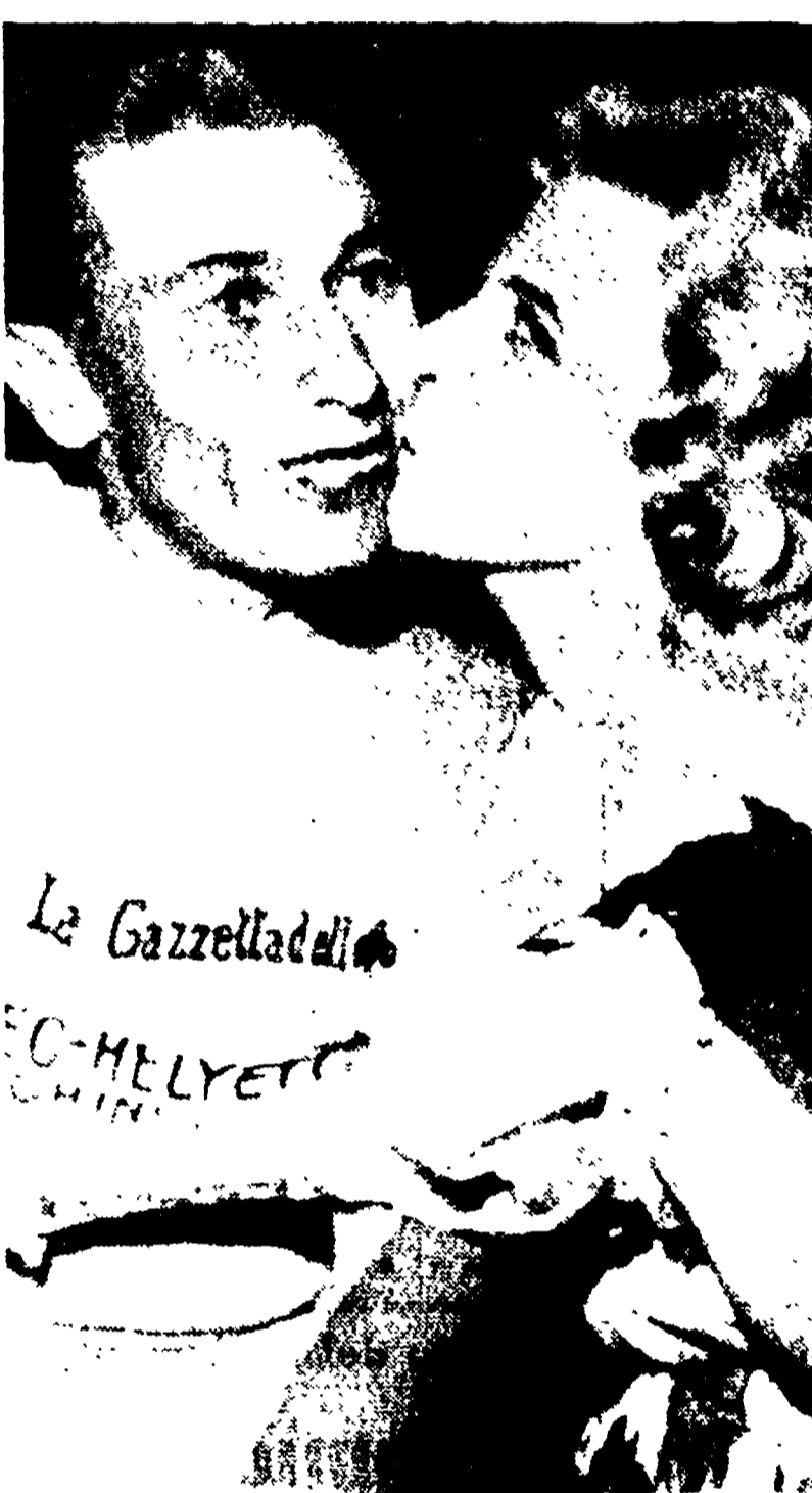
Le Gazzelladi. Anquetil, il campione del mondo, e il suo rivale Nencini.