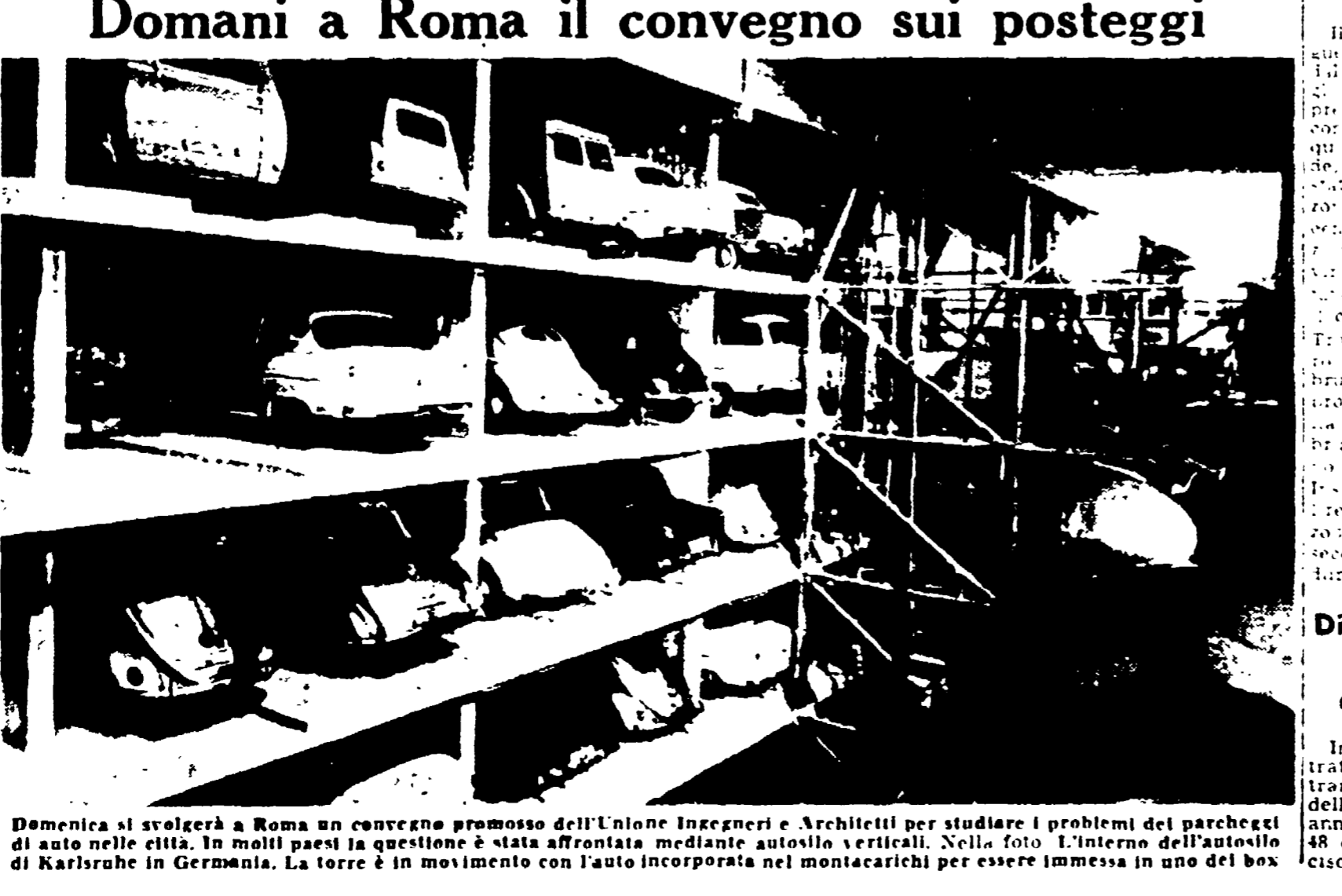
Domani si svolgerà a Roma un convegno promosso dall'Ingegneria e Architetti per studiare i problemi dei parcheggi di auto nelle città. In molti paesi la questione è stata affrontata mediante autoalti verticali.

Praga, 10 — E' confermato per questo autunno la partecipazione ufficiale dell'Italia alla Fiera di Brno (11-25 settembre).