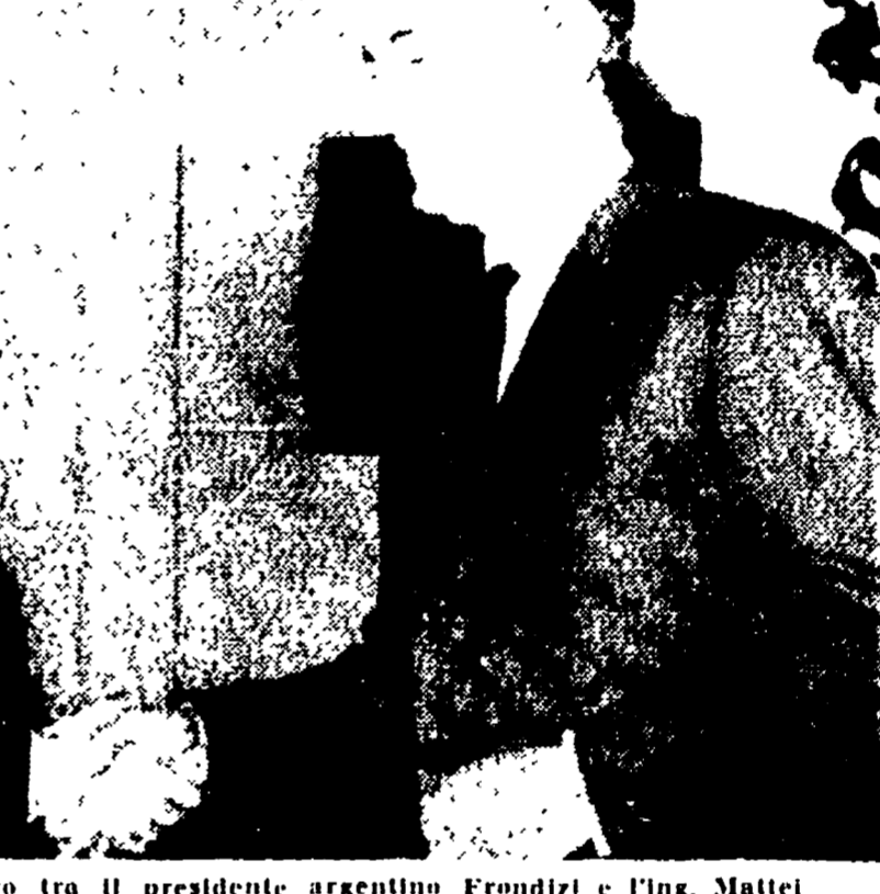
PERUGIA - L'incontro tra il presidente argentino Frondizi e Ing. Mattei