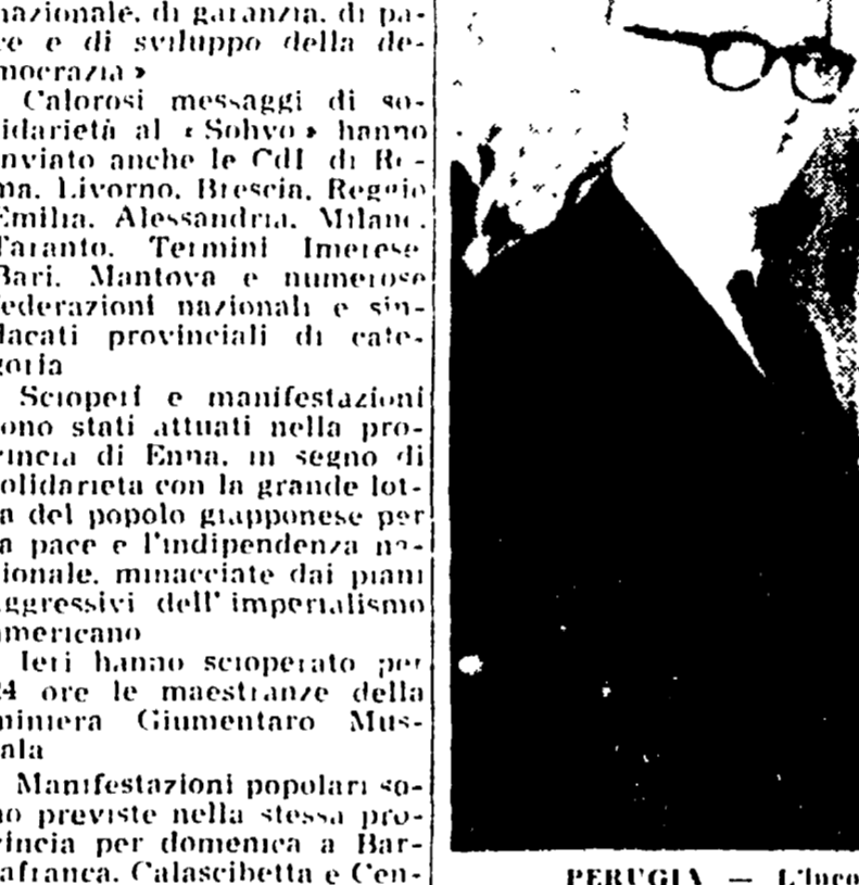
PERUGIA - L'incontro tra il presidente argentino Frondizi e Ing. Mattei