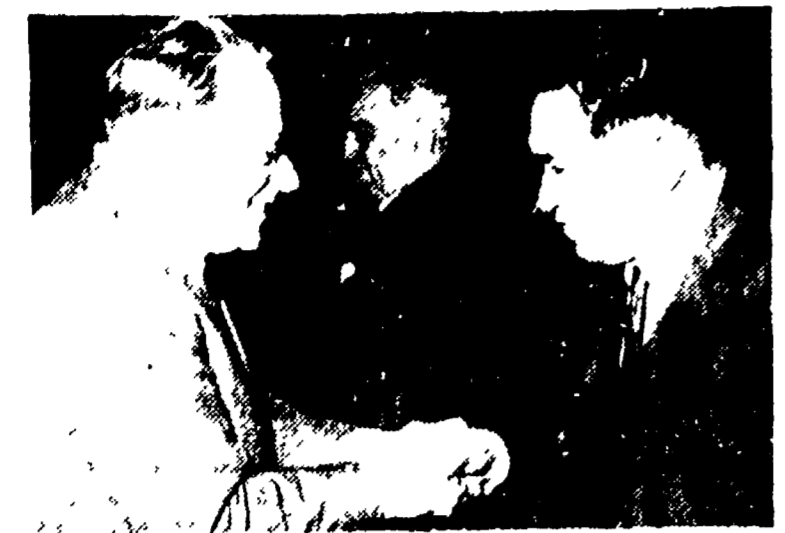
Il compagno Togliatti ha inviato al compagno Miyamoto, segretario generale del Comitato centrale del Partito comunista giapponese...