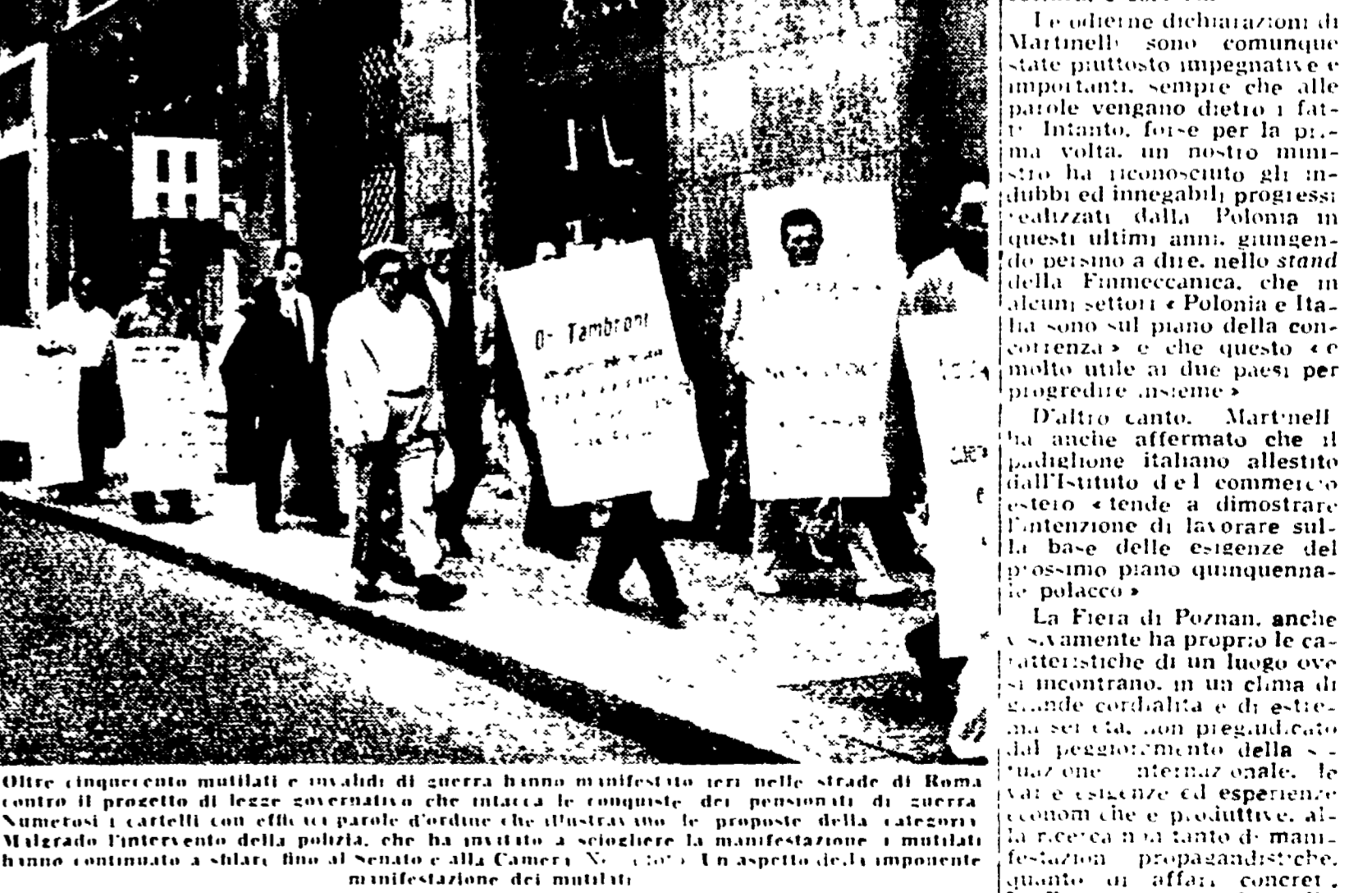
Oltre 100 mutilati e invalidi di guerra hanno manifestato ieri nelle strade di Roma contro il progetto di legge concernente la concessione dei pensionati di guerra. Numerosi i cartelli con effigie di parole d'ordine che illustrano le proposte della categoria. Malgrado l'intervento della polizia, che ha invitato a sciogliere la manifestazione, i mutilati hanno continuato a sfilare fino al Senato e alla Camera. Un aspetto dell'imponente manifestazione dei mutilati.