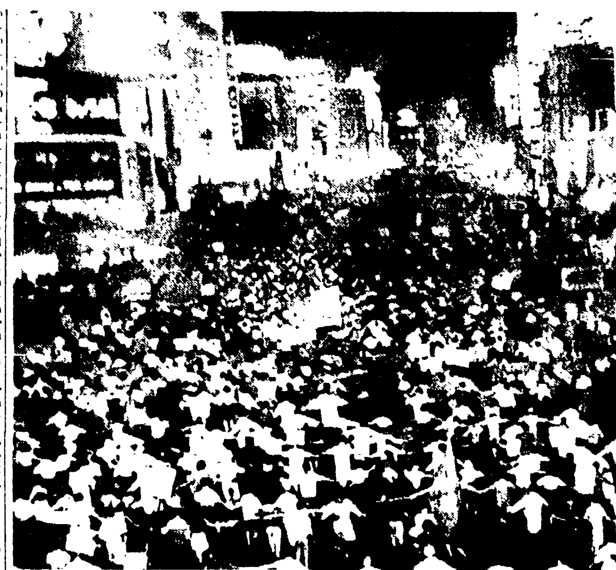
TOKIO - A tarda notte, decine di migliaia di lavoratori e studenti marciarono ancora per le vie della capitale, chiedendo le dimissioni di Kishi...