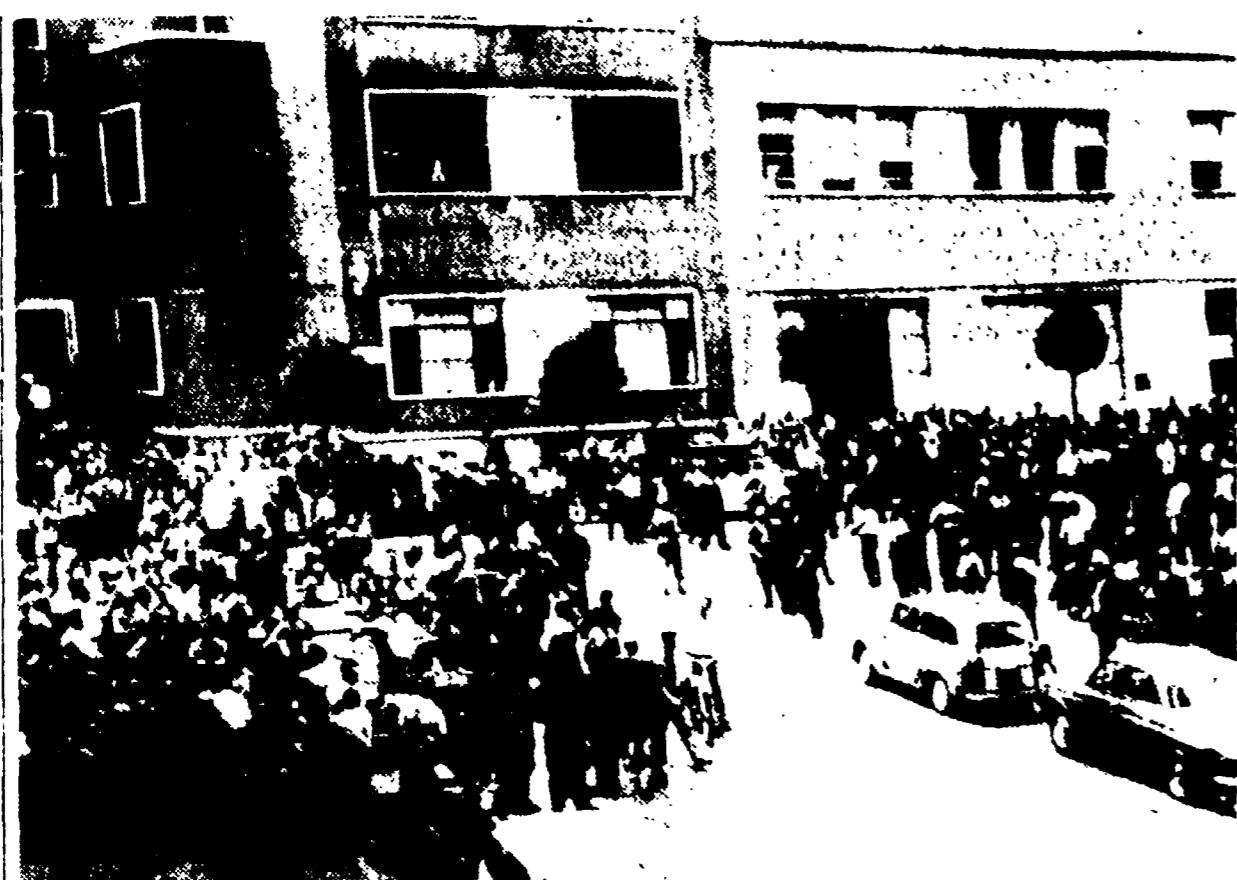
MILANO - A mezzogiorno di ieri gli 8.000 operai dell'Alfa Romeo hanno abbandonato il lavoro dando vita ad un possente sciopero contro il patto separato firmato dalla CISL e dalla UIL. Nella foto: il corteo dello stabilimento mentre gli operai escono dai reparti

Mentre alla Camera i comunisti danno battaglia intorno alla questione dell'industria di Stato, i fatti s'incrociano di confermare la loro appassionata denuncia e di convalidare la giustizia delle loro proposte.