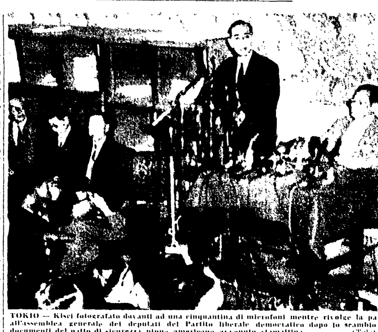
TOKIO - Kisci fotografato davanti ad una cinquantina di microfoni mentre rivolge la parola all'assemblea generale dei deputati del Partito liberato democratico dopo lo scambio dei documenti del patto di sicurezza nippono-americano firmato stamattina.

do appuntamento a Douglas Mac Arthur II nella sua residenza ufficiale. Una corsa in automobile, a gran velocità, due frotte tracciate in fretta, accanto a quella di Eisenhower - viene ora rivelato - aveva apposto su un testo spedito a Tokio fin da prima della sua tornata asiatica, e il destino del Giappone dovrebbe essere segnato per dieci anni.