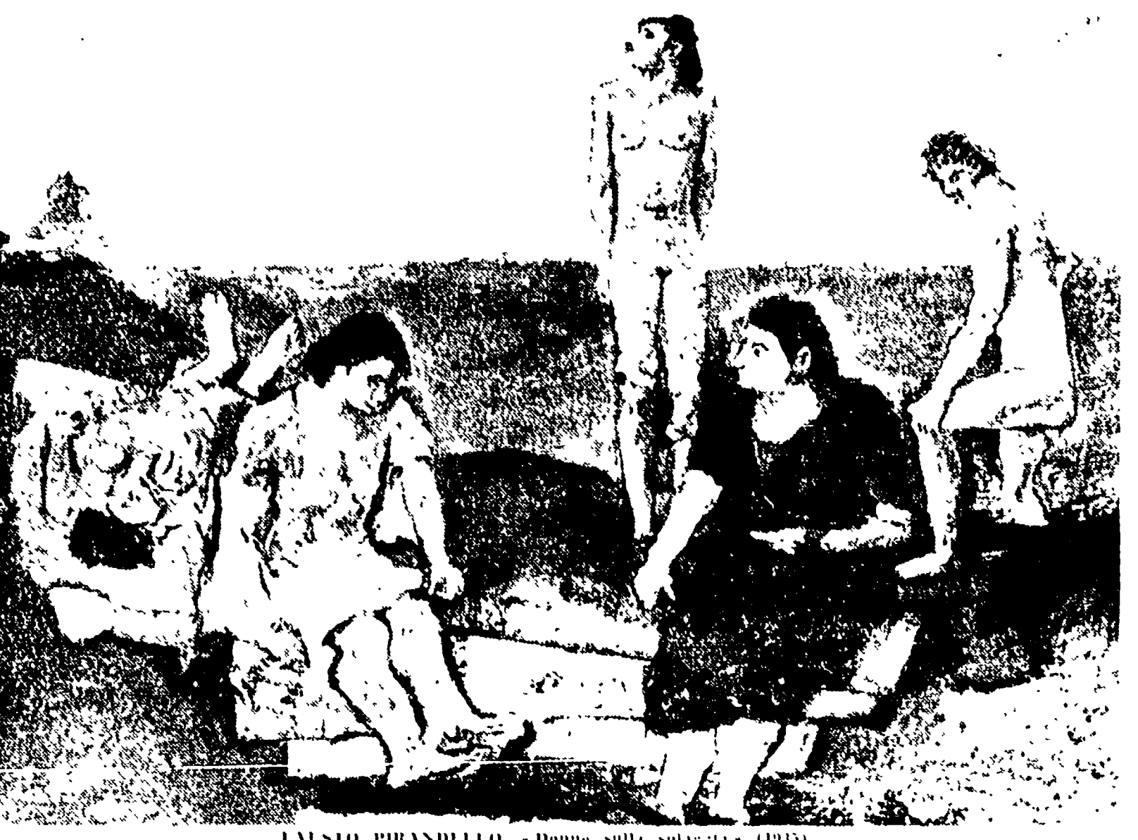
FAUSTO PIRANDELLO - Donne sulla spiaggia - (1935)