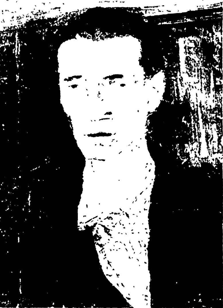
BRUNO CASSINARI - Ritratto di Emilio Morlotti - (1912)

«Napoli com'è» è un libro che, oltre a collare fra certi dati e dati, è impregnato di scienza, di filosofia, di statistica, di sociologia, di foto, di collage, di elaborazioni di una o più «tesori» di mitologia, ha molte delle caratteristiche di un'indagine, a far discutere, ad associare al libro una grande effusione.