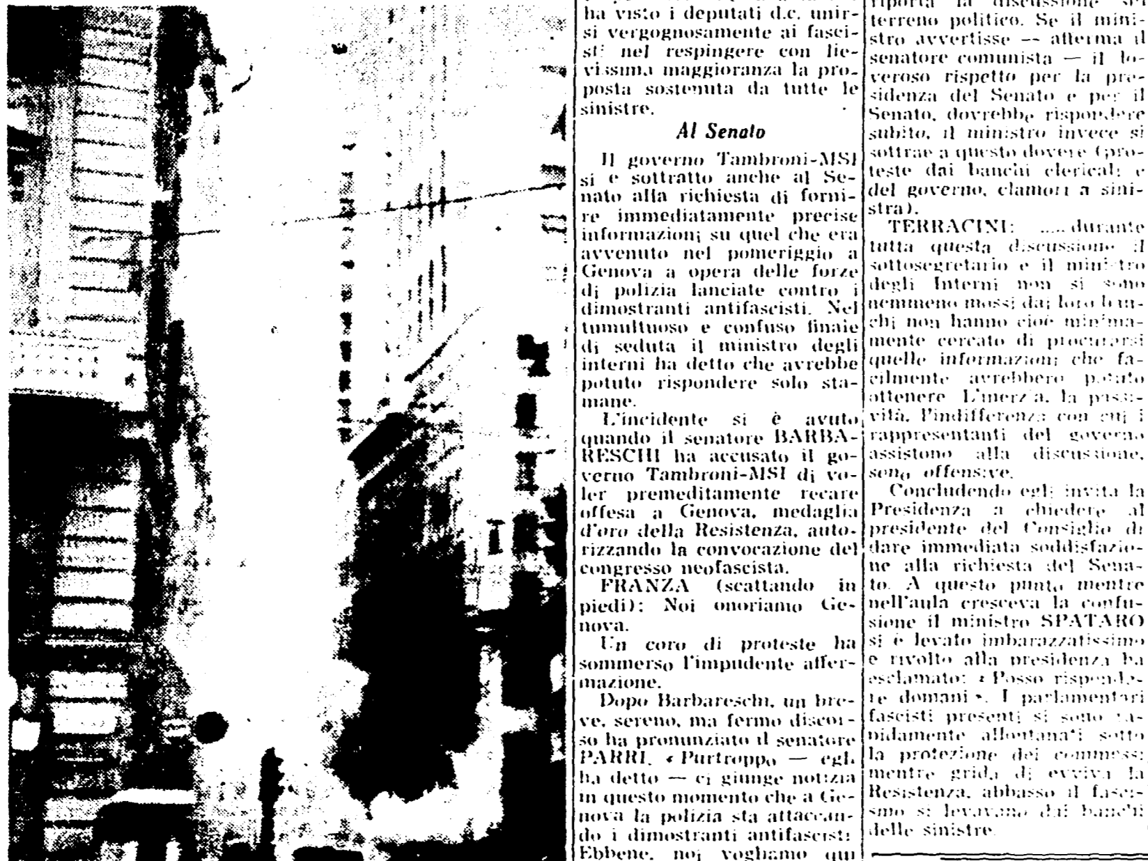
GENOVA — Poliziotti in assetto di guerra avanzano protetti dal fumo dei candelotti lacrimogeni, in via Ceccardo Rocca-tagliata (Ceccardi)