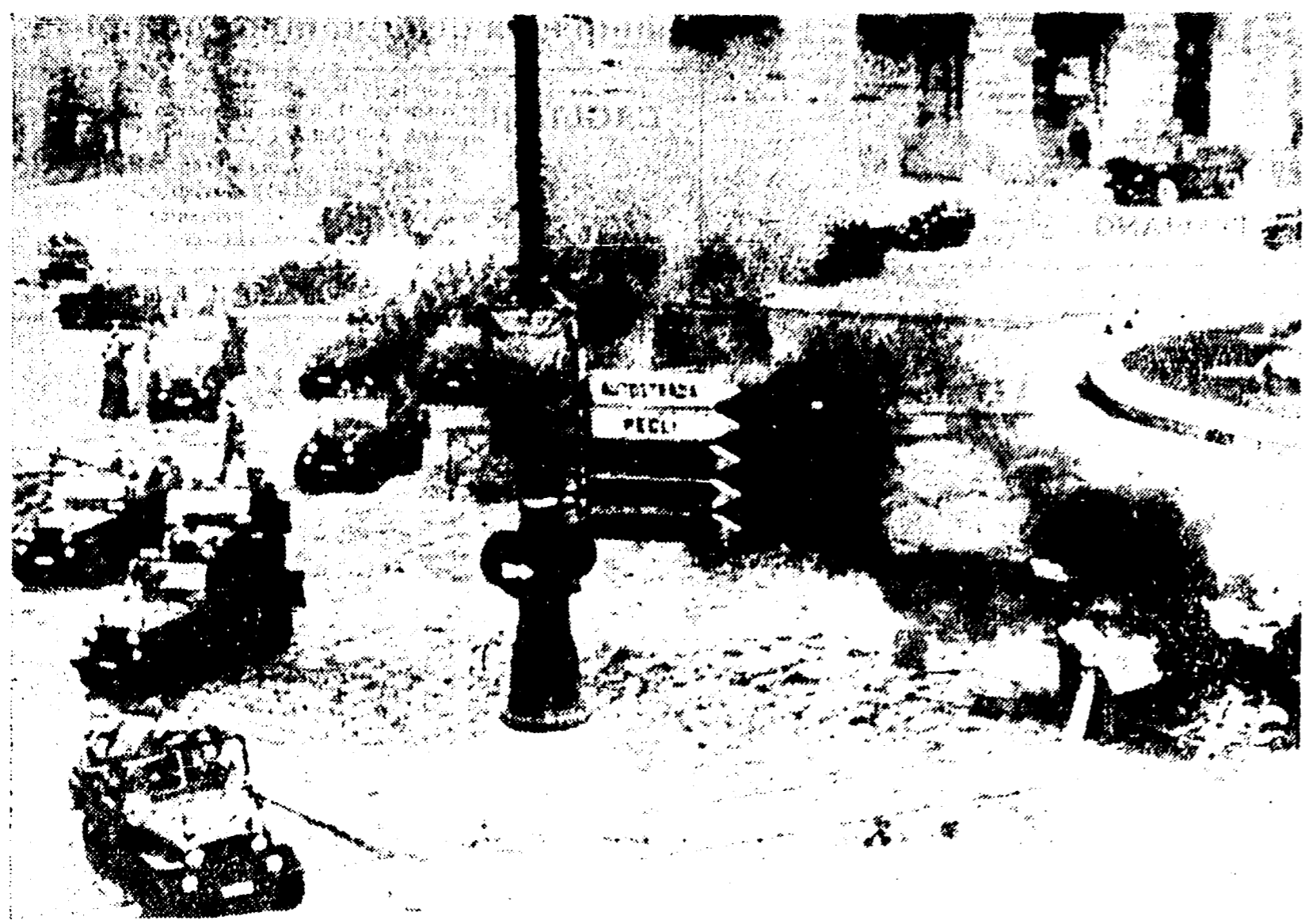
GENOVA — Una carica di camionette in piazza De Ferrari. Sulla destra una camionetta incendiata

Sciopero a Sarzana - Voti antifascisti a Bologna, Venezia, Biella e Ravenna - Protesta delle sinistre al Consiglio di Roma